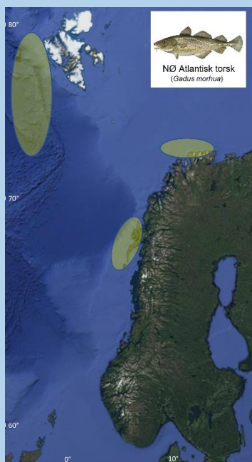
NØ Atlantisk torsk ( Gadus morhua )

Flere hundre torsk ble fisket i Barentshavet og langs kysten av Nord-Norge, og sjekket for kveis ved hjelp av UV-pressmetoden (ISO-std. 23036-1).