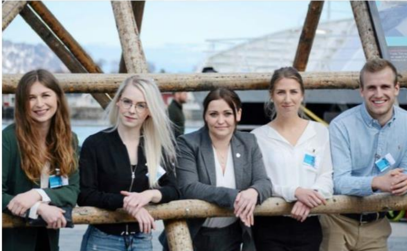
VINNERLAGET: På marin bootcamp i Lofoten.