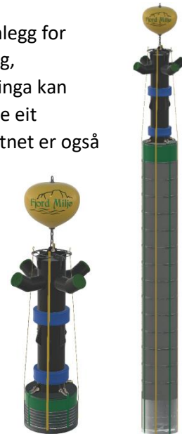
Figur 1. Strømmenrør-flex – det forbetra fleksible Strømmenrøret som vart utvikla igjennom prosjektet.

Strømmenrør-systemet inkluderar automatisert styring basert på målte miljøparameter for å sikre optimal fiskevelferd og samstundes optimalt energiforbruk. Ynskja oksygennivå i skjørtvolumet styrer kva mengder vatn Strømmenrøret flytter. Kontinuerleg logging sikrar dokumentasjon på både korleis fisken har det, og korleis Strømmenrøret bidrar.