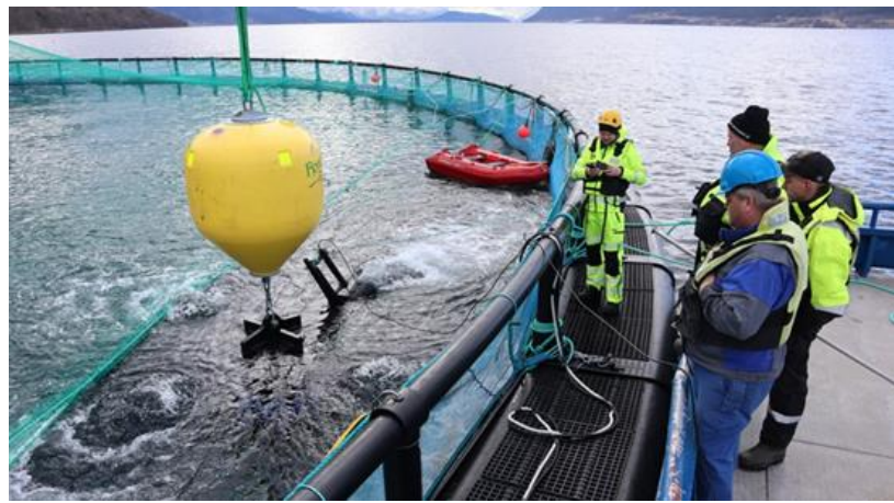
Bilde 3. Testing av kapasitet Strømmenrør-flex.

Strømmenrøret fekk fleire forbetringar igjennom prosjektet. Med StrømmenFlex har røret har fått ei fleksibel lengde – slik at lengda kan justerast ved behov, og for enklare reinhald. Det har også ei lågare vekt og høgare pumpekapasitet.