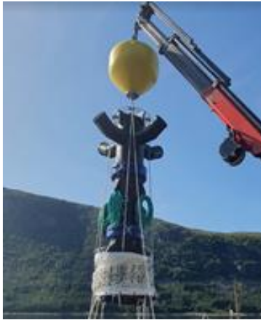
Bilde 2. Strømmenrør-flex på veg til å bli sett ned i merd.

Etter det vi kjenner til er dette det fyrste utsettet i sjø, under ein normal produksjon, som har blitt fulgt opp med ytre velferdsindikatorar fra utsett til slakt. Her var målsettinga å sjå om fysisk installasjon av Strømmenrør utgjorde ein velferdsmessig risiko i forhold. Vi observerte ingen skilnad mellom Strømmen- og kontrollmerder korkje for laks eller rensefisk. Prosjektet gir ein solid dokumentasjon på at Strømmenrør installert i merd ikkje utgjør ein velferdsrisiko for laks og rensefisk.