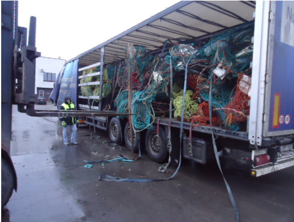
BILDE 1 OG 2: LASTING OG TRANSPORT AV FORSENDELSEN FRA TROMSØ TIL LITAUEN.