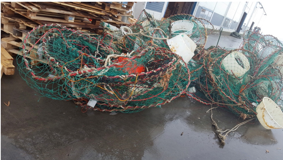
BILDE 5: EKSEMPEL PÅ TEINER LEVERT GJENNOM FISHING FOR LITTER I TROMSØ: FOTO: TROMS FRYSEINDUSTRI

Et flertall av teinene i prøveforsendelsen til UAB Nofir er vurdert å være snøkrabbeteiner. Teinene er kommet på land i forbindelse med trålfiske, og har til dels vært sterkt sammenfiltret og forvridd ved levering. Forsøk på restaurering med tanke på gjenbruk har derfor ikke vært ansett som et reelt alternativ for denne konkrete forsendelsen.