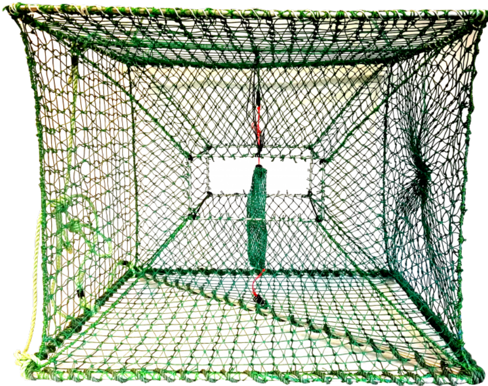
BILDE 4: EKSEMPEL PÅ KONGEKRABBE-TEINE 150X150 CM FRA FRØYSTAD

Et flertall av teinene i prøveforsendelsen til UAB Nofir er vurdert å være snøkrabbeteiner. Teinene er kommet på land i forbindelse med trålfiske, og har til dels vært sterkt sammenfiltret og forvridd ved levering. Forsøk på restaurering med tanke på gjenbruk har derfor ikke vært ansett som et reelt alternativ for denne konkrete forsendelsen.