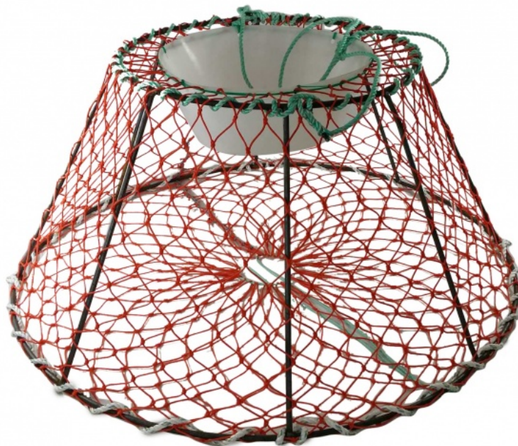
BILDE 3: EKSEMPEL PÅ SNØKRABBETEINE FRA FRØYSTAD. DIAMETER 70-130 CM

Innkjøpspris for fisker vil anslagsvis ligge på rundt 300 – 420 kroner ekskl. mva for snøkrabbeteiner, og mellom 1 300 og 1 900 kroner ekskl. mva for kongekrabbeteiner, avhengig av størrelse.