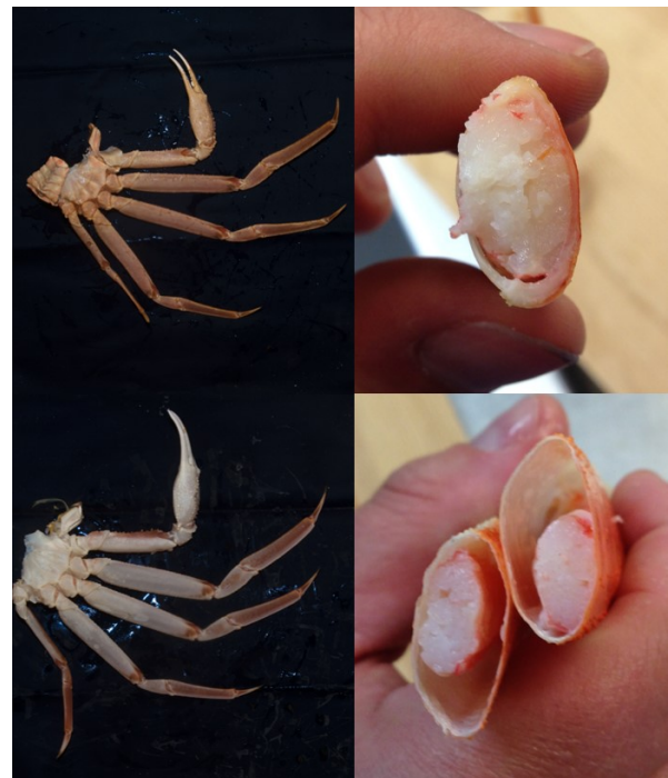
Øverst: Snøkrabbe med høy fyllingsgrad Nederst: Snøkrabbe med lavere fyllingsgrad

Kvalitet måles etter to kriterier: Innhold av kjøtt i bein (kjøttfylde/fyllingsgrad) og antall intakte bein. Slaktede krabbecluster deles inn i tre forskjellige klasser: Superior, N og P. Et cluster med superior-kvalitet har minst de fire største beina intakt og en fyllingsgrad på over 80%. Et