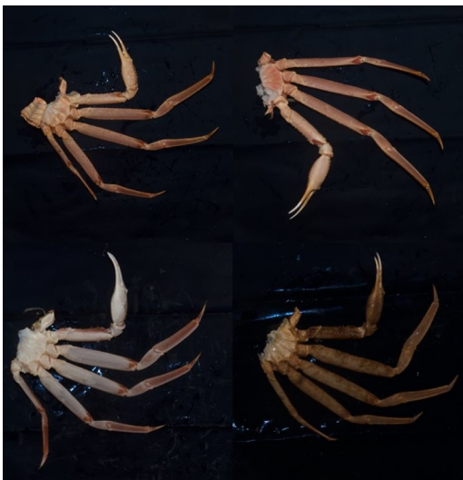
Bilder av snøkrabbecluster rett etter slakting

Snøkrabbefisket i Barentshavet gjennomføres i dag hovedsakelig med om bord prosessering. Sorteringen av prosessert snøkrabbe skjer etter slakting. Under slakting deles krabben i to cluster: venstre og høyre. Hvert cluster sorteres etter vekt og kvalitet. Vektsortering er i dag utført automatisk med en vektcelle koblet til et transportbånd hvor utslagsklaffer sender hvert cluster til sin tilhørende vektklasse.