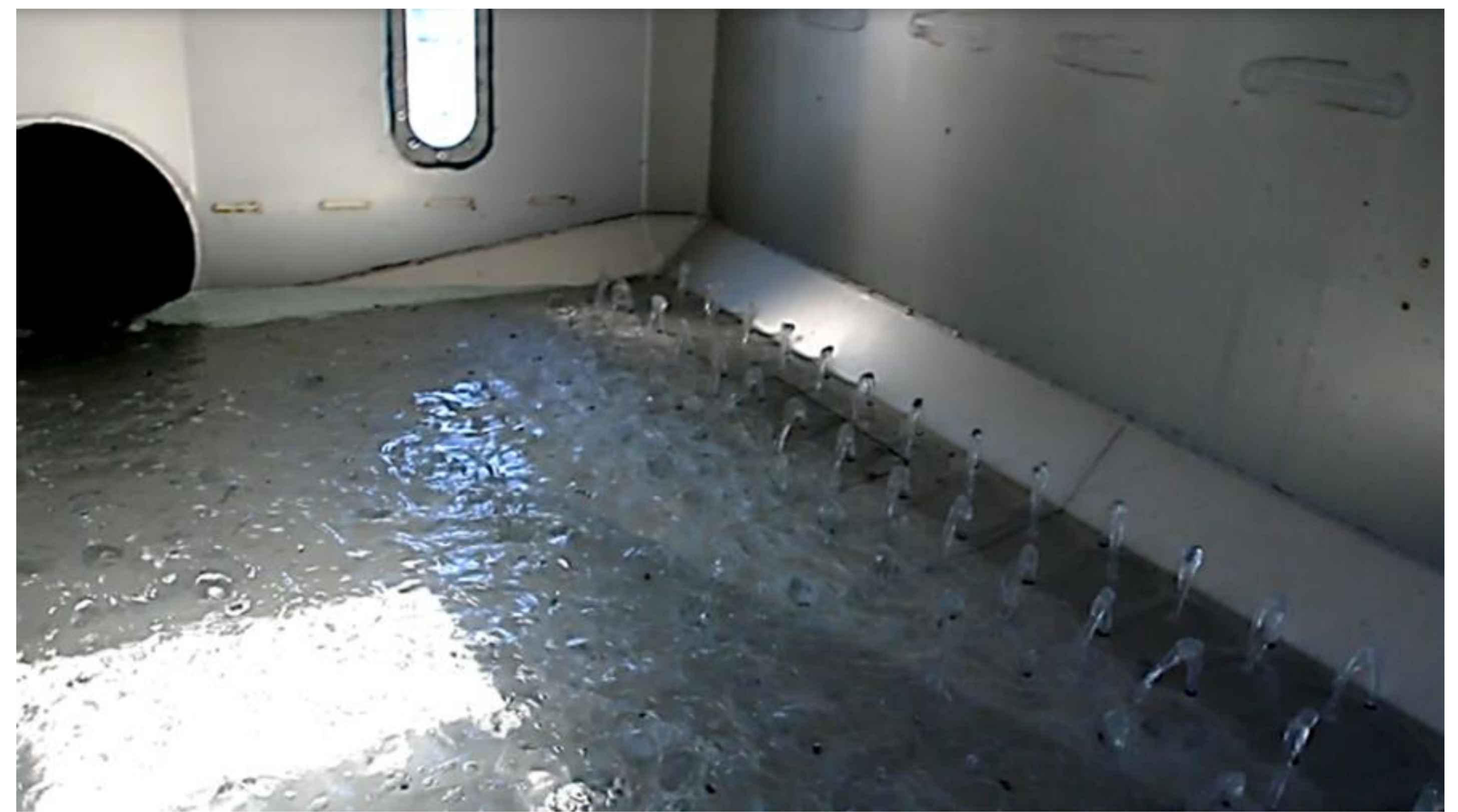
Vannfordelingen (ca. 1000 liter per minutt) opp gjennom den perforerte dobbeltbunnen. Tanken ble fylt i løpet av 4,5 minutter.

Vanntanken er designet etter oppstrømsprinsippet. Friskt vann strømmer i store mengder opp fra bunnen av tanken. Slik renses hele tiden avfallsstoffene opp og ut. Denne tanken rommet 4500 liter og drøyt 2000 kilo fisk.