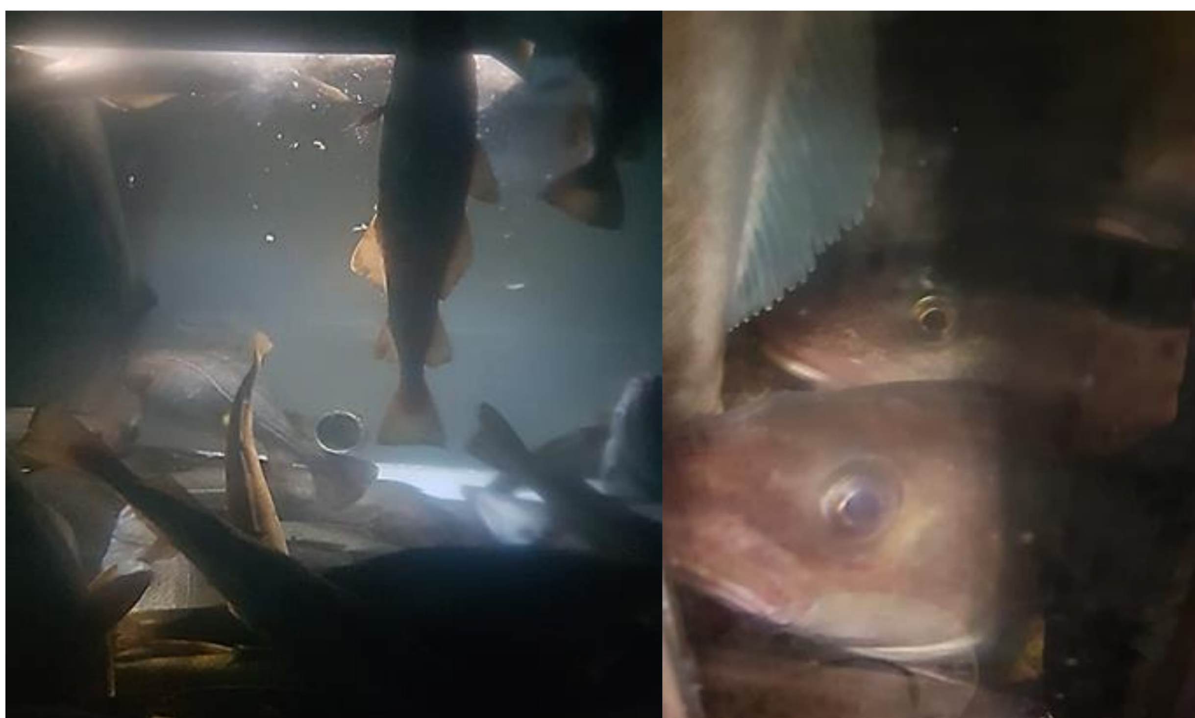
Viser korttids levendelagring av trålfanget torsk i mellomlagringstanken. Etterhvert som fisken restituerer utover i lagringen, blir den nysgjerrig og titter ut gjennom inspeksjonsvinduet.

Etter levendelagring fikk en større andel av fisken lysere grunnfarge i fileten, sammenlignet med fisk som er hentet ut fra produksjonslinjen ombord.