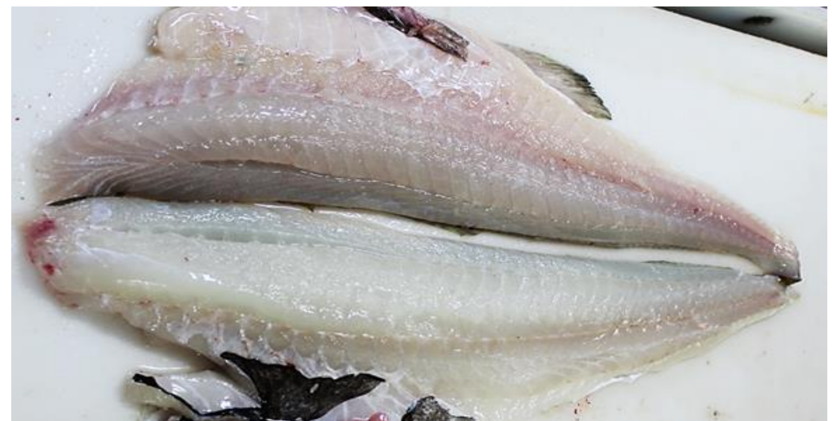
Viser grunnfargen på fileten. En større andel av fisken som er levendelagret i 6 timer før slaktning, har lysere grunnfarge på fileten, sammenlignet med fisk som er hentet ut fra produksjonslinjen 1 time etter ombordtaking.