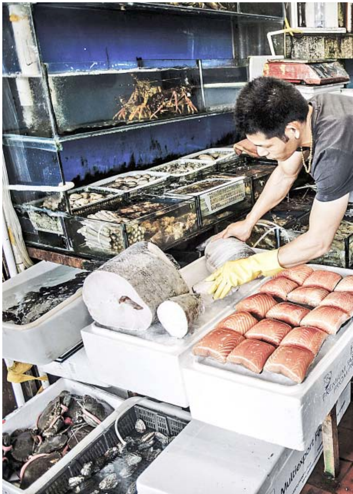
KAN BLI STØRST: Kineserne spiser også tørket fisk og Kina kan bli det største markedet for norsk tørrfisk, m