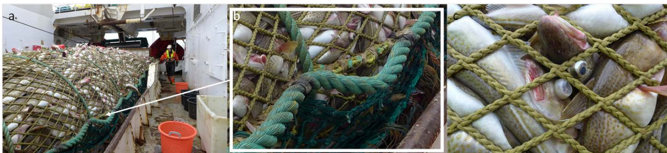
Figur 1: Bilder av 2PYK sekken tatt om bord. Bilde (a) viser 2PYK sekken som blir mye brukt i dagens trålflåte, bilde (b) viser sekken mer i detalj, og bilde (c) viser fisk i sekken som er hardt presset mot nettingen med knuteløst lin.

De ulike konfigurasjonene av trålsekker som ble testet er som følger: