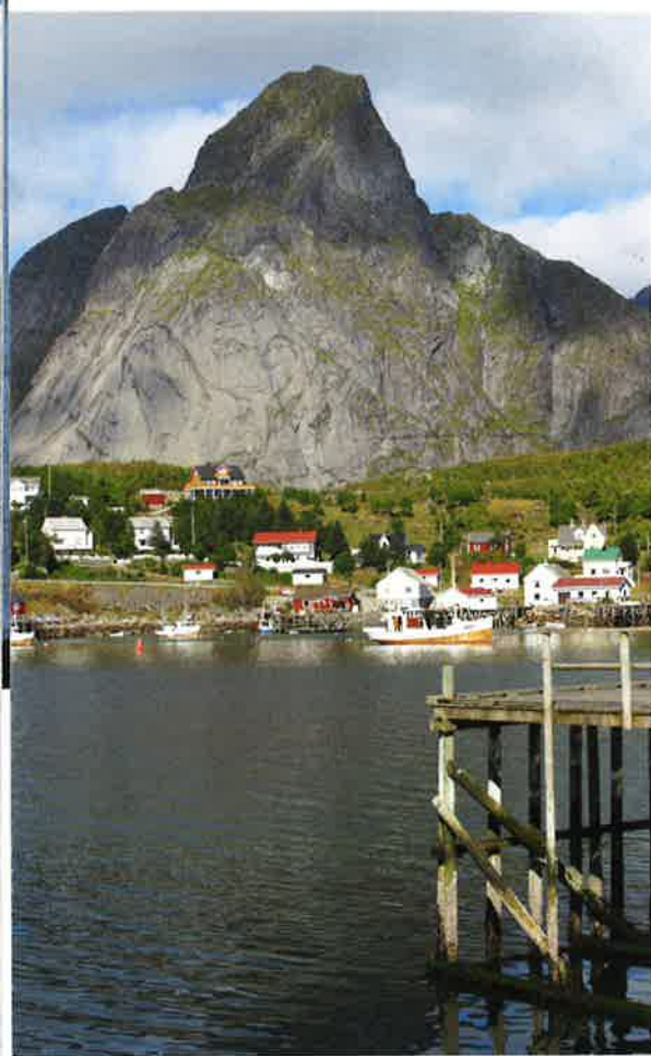
Et av formålene bak fjordlinjereguleringene er å styrke kystsamfunn og samiske lokalsamfunn.

dag er det ingen som kjøper seinotfangst i og rundt fjorden, og fartøyene må derfor føre fangsten relativt langt for levering.