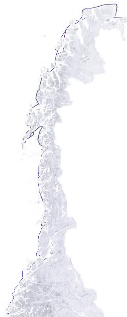
Fjordlinjer nord for 62°N. Innenfor disse er det et generelt forbud mot fiske med fartøy over 15 meter, eller fiske med snurrevad. Linjene i magenta viser unntakene for seinotfiske med fartøy under 28 meter.

Fjordlinjer synes å ha en rolle i fremtidens fangstreguleringer, både for kystnære arter, redskapsbruk og fartøystørrelse, og i hensynet til skjerming av den minste kystflåten. I så måte vil det være interessant å se hvilken avgjørelse departementet ender opp med i sin vurdering av de forslag til fjordlinjebestemmelser som nå er under sluttbehandling, også med tanke på redskapsbegrensninger innenfor fjordlinjene og registrering av turistfiskeomfanget. Våre analyser tyder på at økt kunnskap om lokal næringsstruktur og lokale biologiske forhold er nøkkelen til å redusere de tap som påføres aktører som utestenges og nytten til dem som beskyttes av denne reguleringsformen. Den utviklede analysemodellen er krevende, men gir et strukturert verktøy for nettopp å utvikle slik kunnskap.