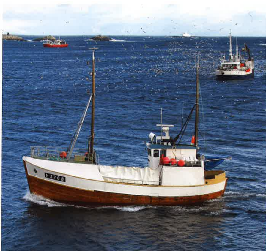
En lengdegrense på 15 meter gir ikke nødvendigvis en riktig begrensning på fangstkapasitet og effektivitet. Like lange fartøy kan utvise store forskjeller i kapasitet og effektivitet!

Mindre notfartøy som ikke trenger dispensasjon for å fiske innenfor fjordlinjene, oppgir at det er uproblematisk for dem å fiske side om side med de store. I enkelttilfeller kan de faktisk dra nytte av den større flåtens tilstedeværelse ved at de tilføres overskytende fangst. De fleste respondene fra den lokale flåten var i utgangspunktet motstandere av dispensasjonsadgangen, både som følge av mindre plass og mulige redskapskonflikter, samt usikkerhet rundt notflåtens bifangst av hvitfisk. En påpekte imidlertid fordelene ved at det nå unngås at sild dør ned i trange fjorder, med de følger det har for bunnfauna og øvrig liv i fjorden. Kjøperne av hvitfisk i området som vi intervjuet så ingen direkte betydning av dispensasjonen for egen del, men var opptatt av sildnotflåtens etterlevelse av bifangstreglene i sildefisket.