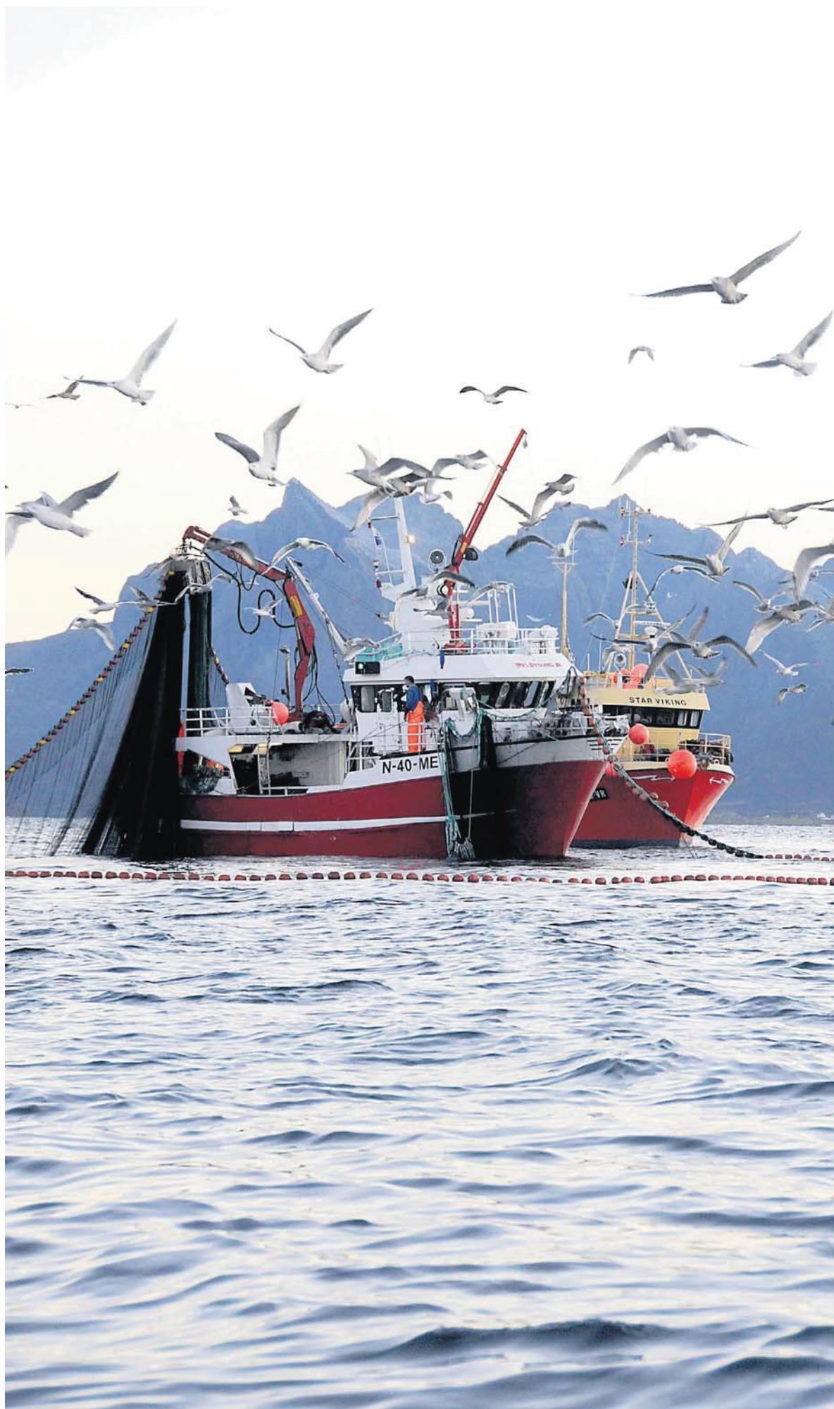
IKKE FORNØYD: Seinotflåten er lite fornøyd med å bli utestengt fra fiskefeltene inne i Varangerfjorden.