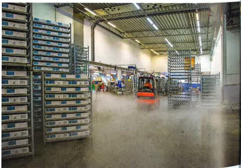
Pelagisk industri, som dette Pelagia-anlegget, bidrar i likhet med hele næringen til brutto nasjonalproduktet — verdiskapingen i landet. Dette er hovedgrunnen til at fellesskapet ønsker slike anlegg langs kysten.

Den siste uken i januar i år samlet åtte vel skolerte representanter for tre forskningsinstitusjoner seg over møtebordene hos Nofima i