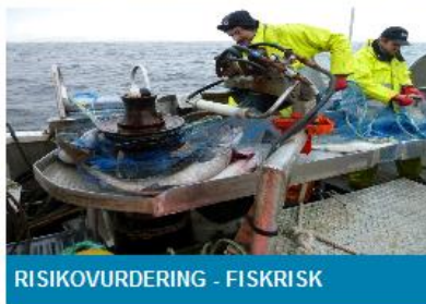
RISIKOVURDERING - FISKRISK