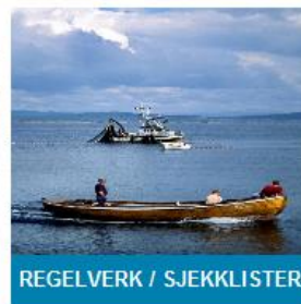
REGELVERK / SJEKKLISTER