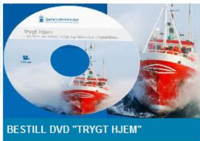
BESTILL DVD "TRYGT HJEM"