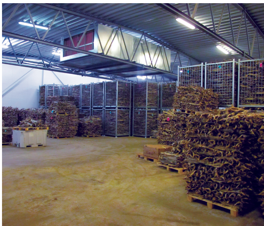
Pilotanlegget for klimastyrt lagring av tørrfisk som er etablert på Værøy.

Målet for dette prosjektet har derfor vært å utvikle og sikre nye lagringsformer slik at tørrfiskbransjen kan gå over til lagring i mer kontrollerte former. Dette vil sikre jevn, god og forutsigbar kvalitet på tørrfisken, i tillegg til å redusere vekttap under lagring. På denne måten kan næringen oppnå bedre kvalitet og en bedre pris for produktet, samtidig som skader og tap på grunn av uheldig lagring minimeres. Dette kan gi et mer forutsigbart produkt og gir bedre kontroll på kvaliteten. Dette gjør at en takler bedre forskjeller i råstoffet og tilpasser produktet lettere til ulike markeder.