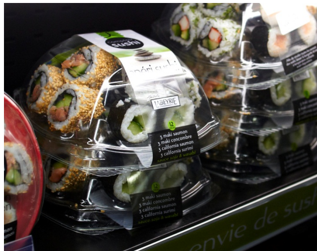
Figur 5 Brettpakket sushi fra Labeyrie.

Den fjerde produsenten vi så, var Labeyrie/Del Pierre. De utmerket seg blant annet med delikate brettpresentasjoner.