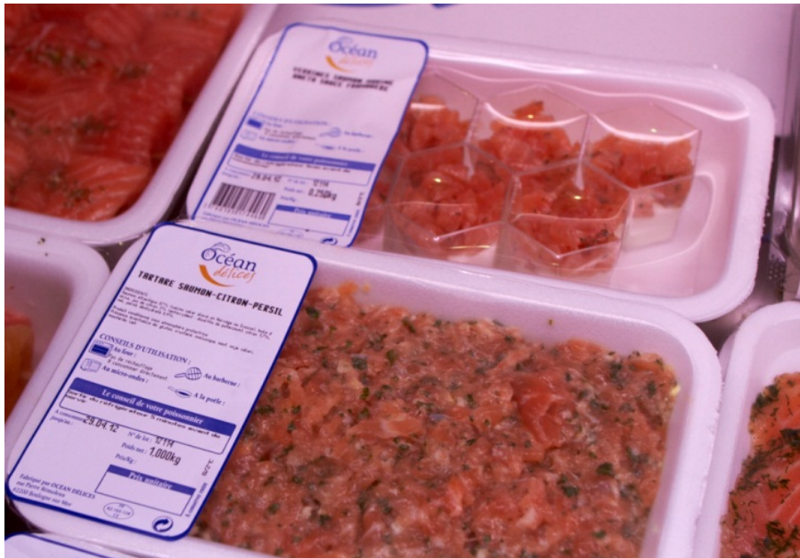
Figur 12 Marinert laks til for eksempel tartar

Vi var ikke på omfattende butikkrunder i Frankrike, men så likevel eksempler på andre retter av rå fisk, hvor laks inngår. Rettene på bildene under er for øvrig produsert av Océan delices, som vi intervjuet i Boulogne-sur-mer.