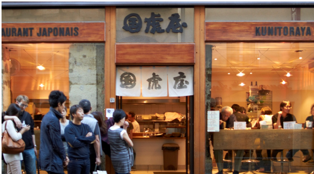
Figur 14 Tradisjonell japansk restaurant i Paris

I det japanske området ligger de autentiske japanske sushirestaurantene på rad og rekke. Noen er tydelig mer populær en andre, med kø på usiden. Disse restaurantene er relativt små, med tradisjonell disk hvor sushikokkene lager maten mens kunden ser på.