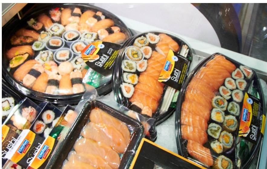
Figur 4 Et utvalg brett med sushi fra Côté Phare

Norway Seafoods er også tilstede i dagligvarehandelen i Frankrike, de eier en fabrikk i Casets i sør-vest, som produserer sushi under merket Côté Phare. Vi så ikke noen av disse i de butikkene vi besøkte, bildet under er tatt på sjømatmessen i Brussel. Her ser vi et utvalg pakningsstørrelser med ferdig sushi.