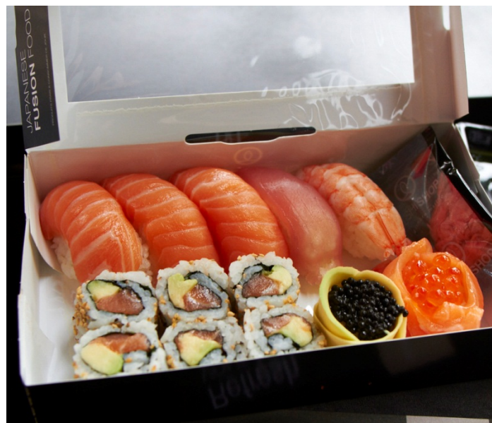
Figur 18 Take-away fra Sushi Shop

Sushi som take-away/ levert på døra har den fordelen at man kan oppnå en spisekvalitet som ligger helt opp til restaurantkvalitet. Kjederestaurantene har som regel også tilbud om take-away, som man enten henter selv eller får levert.. En av kjedene vi snakket med, Matsuri, oppgav at take-away stod for 10–15 % av omsetningen, mens levering stod for cirka 20 %. Hjemmelevering inkluderer også levering av lunch til forskjellige arbeidsplasser, noe som er et stort og voksende segment. Bildene under er take-away fra en Sushi shop-restaurant. Sushi shop har tidligere rapportert om at hele 80 % av omsetningen er basert på utkjørt eller hentede produkter.