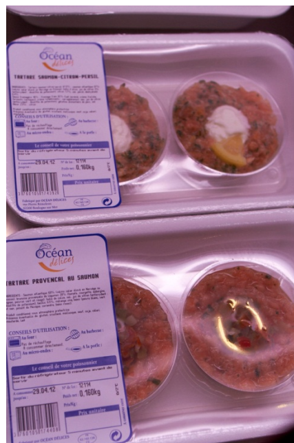
Figur 13 Tartar av laks