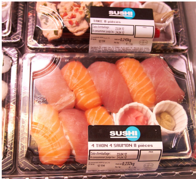
Figur 6 "Gourmetsushi" fra Traiteur Côte Mer

En av utfordringene knyttet til distribusjon av gourmetsushi, er faktisk at temperaturen under transport kan bli for lav. Fisk blir normalt distribuert med kjølebiler som holder en temperatur på 0–4 grader, mens man for risen sin del burde hatt høyere temperatur. Traiteur Côte Mer mener at sushi burde bli oppbevart på 7 grader for å beholde mest mulig av spisekvaliteten på risen.