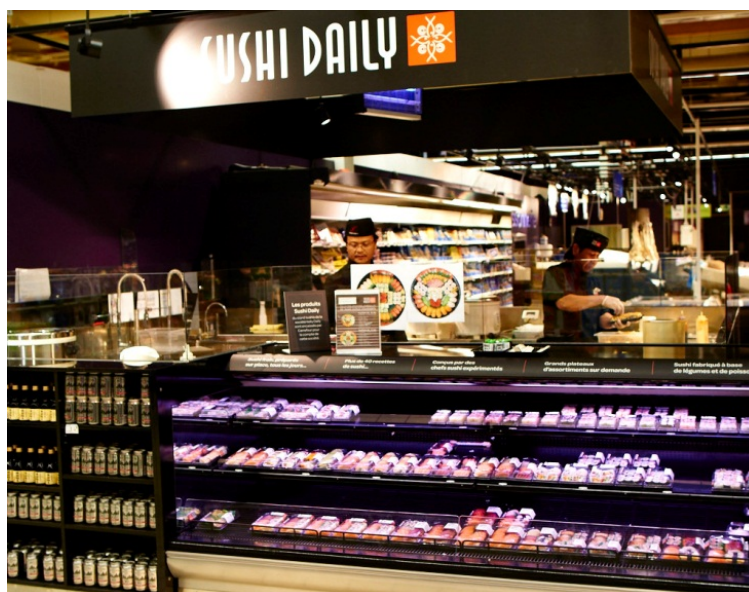
Figur 7 Produksjons- og utstillingsarealet i Carrefours hypermarked i Cherbourg

Første ladning brett skal være klar klokken 9 om morgenen, og ellers produseres det jevnt ut over dagen, slik at det alltid finnes fersk sushi i disken.