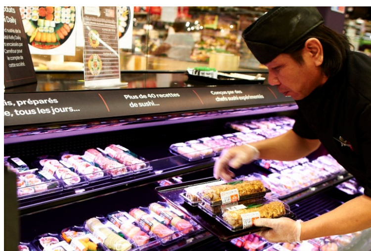
Figur 8 Påfylling i disken hos Sushi Daily

Første ladning brett skal være klar klokken 9 om morgenen, og ellers produseres det jevnt ut over dagen, slik at det alltid finnes fersk sushi i disken.