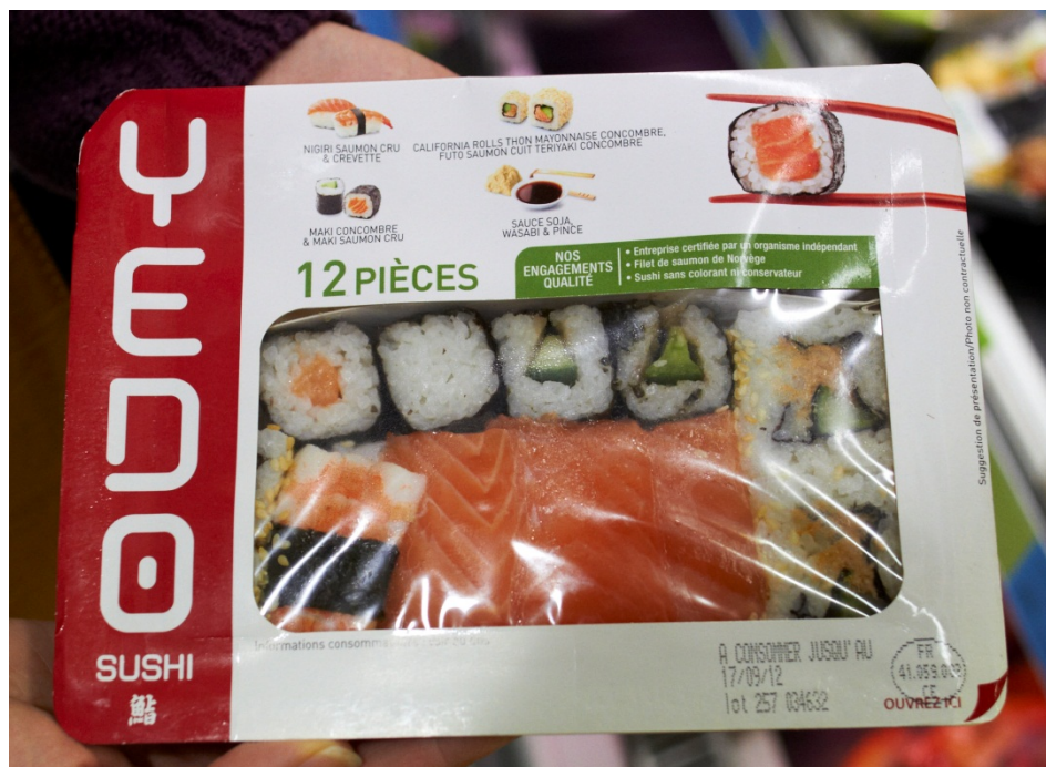
Figur 2 Brettpakket sushi fra YEDO

Det største merket er Yedo, som produseres av Marco Polo. Yedo har en anslått omsetning på 42 millioner € i året (2012). De har et bredt utvalg av brett med ulike kombinasjoner av biter. Bitene er likevel relativt enkle, og med en kvalitet som gjenspeiler en holdbarhet på 4–5 dager.