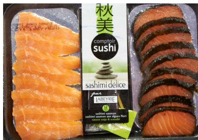
Figur 11 To typer sashimi på pappbrett

Sashimi finner man også i litt andre typer pakninger enn de vi har sett i Tyskland og Norge. Her et eksempel på vakuumpakkede biter på pappbrett.