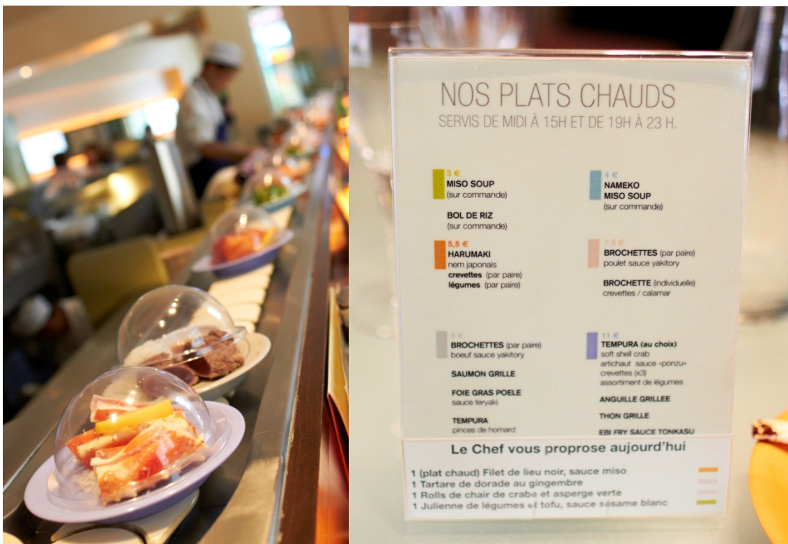
Figur 16 Rullebånd med kongekrabbe i front, samt meny fra samme sted Lô Sushi, Paris)

Vi intervjuet en restauranteier med 6 restauranter (Sushi Ba), på noen måter som en kjede, men likevel mest som en enkeltrestaurant, da eieren stod for ledelse og innkjøp for alle restaurantene.