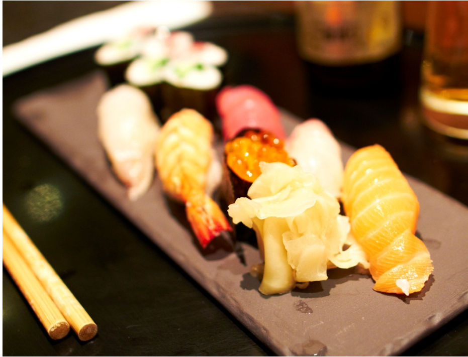
Figur 15 Tradisjonel japansk sushi