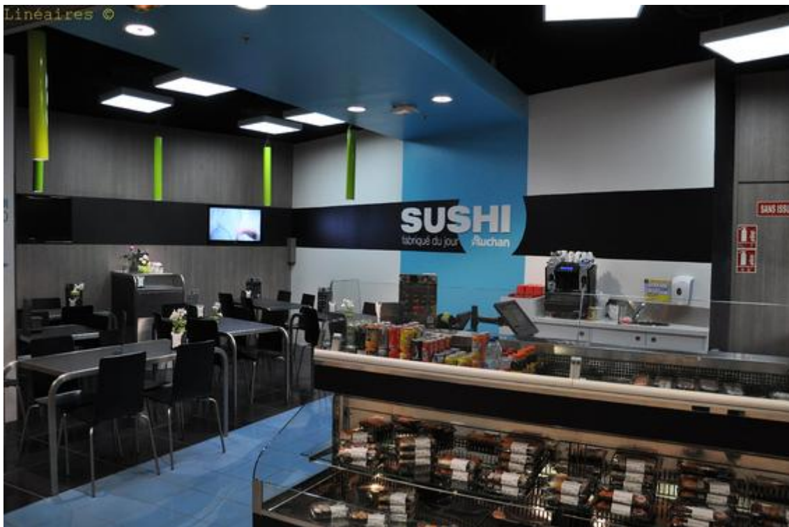
Figur 10 Sushihjørne hos Auchan