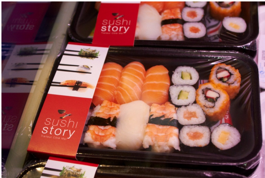
Figur 3 Brettpakket sushi fra Traiteur Côte Mer

En annen produsent i dette segmentet er Traiteur Côte Mer, som vi også intervjuet i Boulogne sur Mer. Traiteur Côte Mer forteller om en omsetning på sin sushiproduksjon på 3 millioner € pr år (2012).