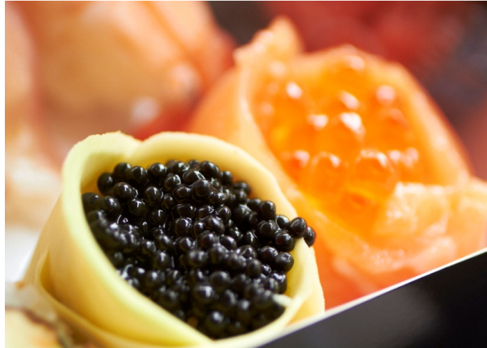
Figur 19 Take-away gir muligheter for mer avanserte biter

Både utvalg og ferskhet skiller seg ganske markant fra brettene man finner i volumsegmentet, men ikke fullt så mye fra brettene man får fra shop-in-shop. Med take-away får man, i tillegg til ferskheten, også normalt større frihet i valg av biter, og ofte enda mer «krevende» biter. Prisvariasjonen på bitene er meget stor avhengig av leverandør, hvilke råvarer som inngår og hvor avansert biten er.