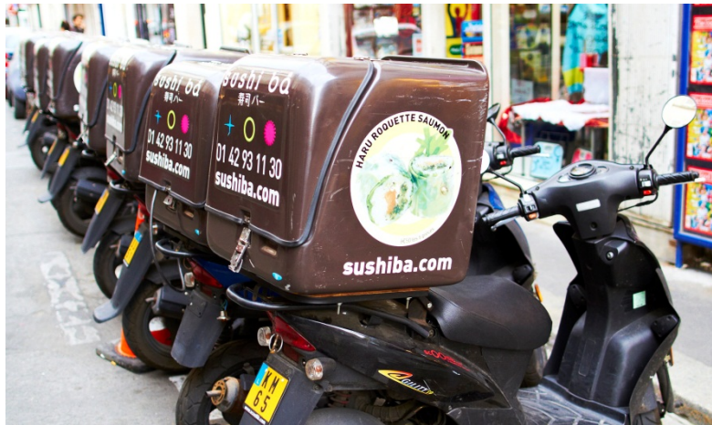
Figur 17 Mopeder er vanlig for utlevering av sushi

Vi intervjuet også en kvalitetsansvarlig for en kjede med 13 restauranter, Matsuri. Med 13 restauranter kjøper de 120 tonn laksefilet i året, mens Sushi Ba med 6 restauranter kjøpte nærmere 100 tonn hel laks i året (vårt anslag basert på opplysninger om ukentlige innkjøp). Laksen var i stor grad norsk fra Marine Harvest eller Lerøy.