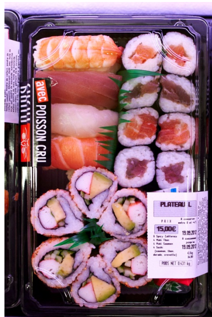
Figur 9 Eksempel på brett pakket sushi fra Sushi Daily

lettere gjøre nødvendig forarbeide før man begynner arbeidet med å innføre en ny bit i Sushi Daily inne i Carrefour.