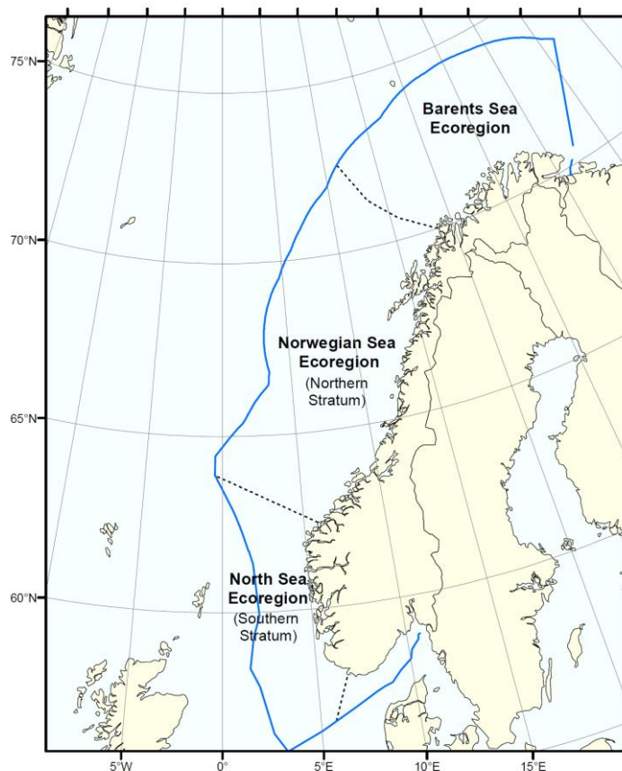
Figur 1. Kart over økoregionene brukt i den norske rødlisten. Vi har brukt data fra det nordlige og det sørlige stratum.