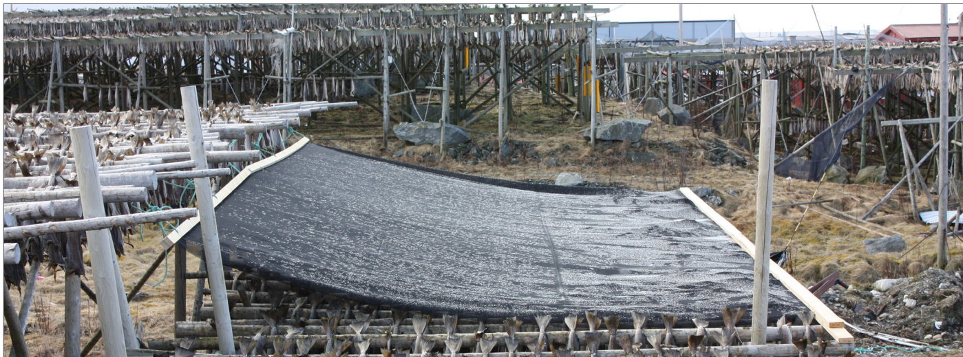
Tørrking av fisk under nett på hjell i sør/nord retning. Fisk under nettet henger i sør og fisk i kontrollgruppen uten nett henger i nordenden.