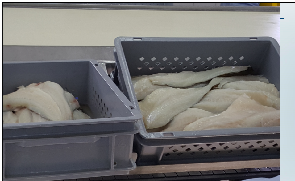
Sjøfryst linefisk. Fisk kastet ut pga feil til venstre.