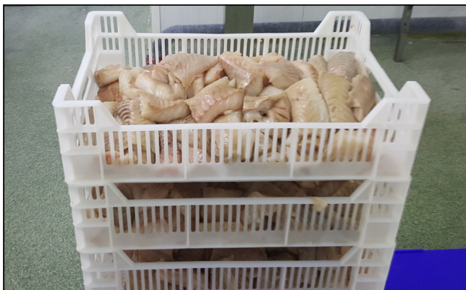
Trålfisk, mente denne var fersk