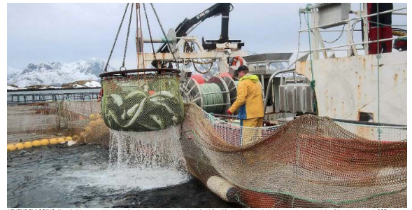
LEVENDELAGRING: Nergård-konsernet leverer rekordmønstre og rekordresultat i fjor. Men miljøparten det jobbes mest over, er at de nå kan levere torsk 365 dager i året til kundene i Europa. Det er takket være levendelagring av torsk.