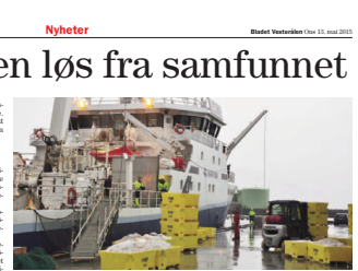
Hvorfor problematiserer ikke Tveteråsutvalget at et eventuelt inntøgsuttak som Akers har spilt inn sin inntøgsrett vedrører Noregs Kystfiskarlag (arkivfoto)

- Forkastelig Kystfiskarlaget mener fiskeripolitikken både skal forvalte fiskeressursene og det samfunnsbærende