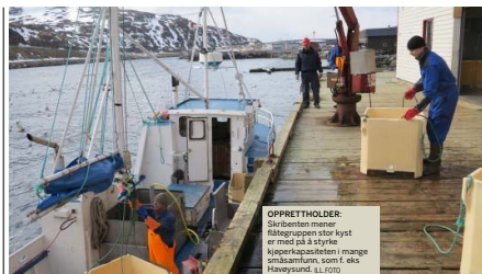
OPPRETTTHOLDER: Sur-bomben mener fiskegruppene stor kyst er med å styrke fiskekapasiteten i mange småsamfunn, som t. eks. Havøystrand.

I januar 2016 kom fiskeriminister Per Sandberg ut med en ny fartøyinstruks for kystflåten i Norge. Den er en forenkling og standardisering av tidligere praktisert praksis. Den sier at en fartøyskvote med hjemmelslengde under 11 meter ikke kan flyttes opp til et større fartøy enn 14,99 meter etter ønske fra landsmøtet i Norges fiskarlag 2015 i Trondheim. Videre standardiseres også muligheten for at hjemmelslengder over 11 meters hjemmelslengde kan plasseres på alle fartøy over 11 meters lengde, opp til 500 kubikkmeter lasterom. Dette er bestemmelse som tilsier at den tidligere praksisen blir standardisert for hele landet og gjør det mulig for alle med kvoter over 11 meter å drive med det fartøy de ønsker å bruke til fiske.