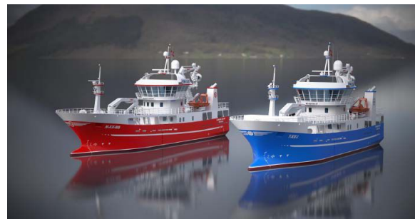
TO NYBYGG: «Sander Andre» (L) og «Nordhavet» klar for bygging ved Larsnes Mek. Verksted.