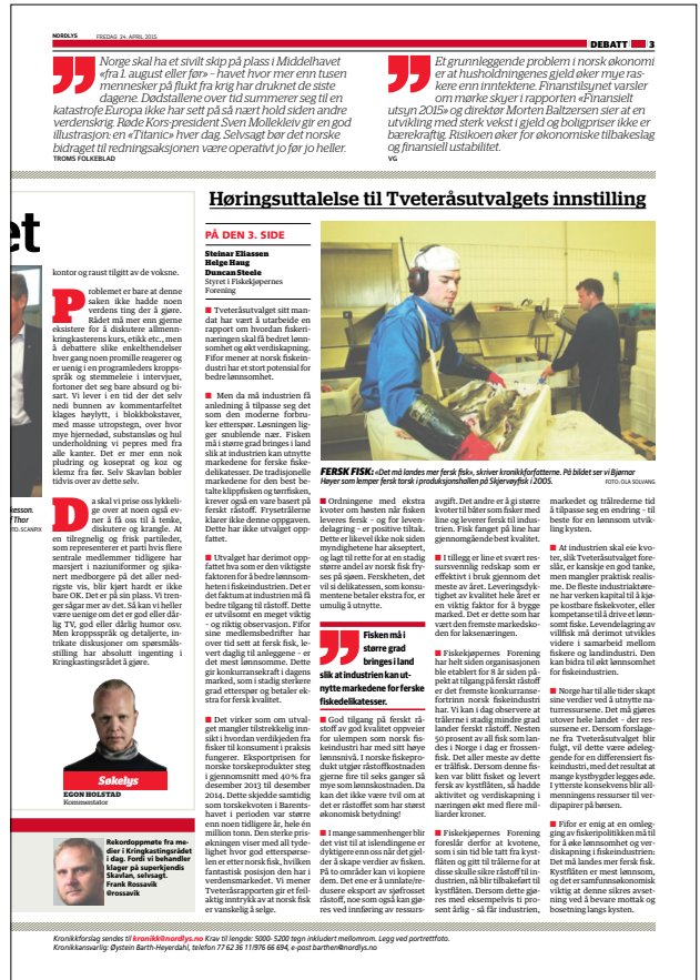
Konkurranselag Nordlys AS. Foto: Nofima AS. Kilde: Nordlys. Logg ved portrettfoto. Konkurranselag Nordlys AS. Foto: Nofima AS. Kilde: Nordlys.

Det virker som om utvalget mangler tilstrekkelig innsikt i hvordan verdikjeden fra fisker til konsument i praksis fungerer. Eksportprisen for norske torskprodukt steg i gjennomsnitt med 40 % fra desember 2013 til desember 2014. Dette skjedde samtidig som torsk kvoten i Barentshavet i perioden var større enn noen tidligere år, hele én million tonn. Den sterke prisøkningen viser med all tydelighet hvor god etterspørselen er etter norsk fisk, hvilken fantastisk posisjon den har i verdensmarkedet. Vi mener Tveteråsrapporten gir et feilaktig inntrykk av at norsk fisk er vanskelig å selge.