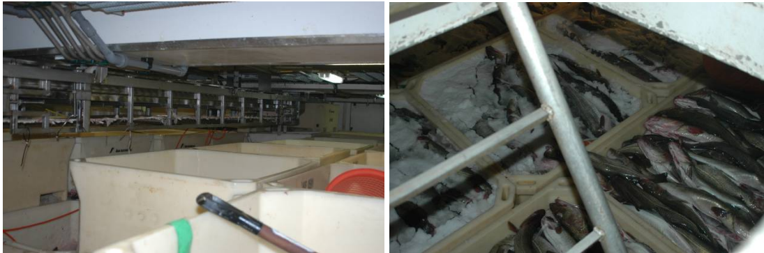
Bilde 9 Det er trangt i lasterommet, til høyre slurry-iset fisk i kar

via slanger fra tanken og til lageret. Dette fungerte fint under denne turen. Isslurrien hadde en isandel på ca 30 % og holdt en temperatur på ca -2,5 °C på tanken.