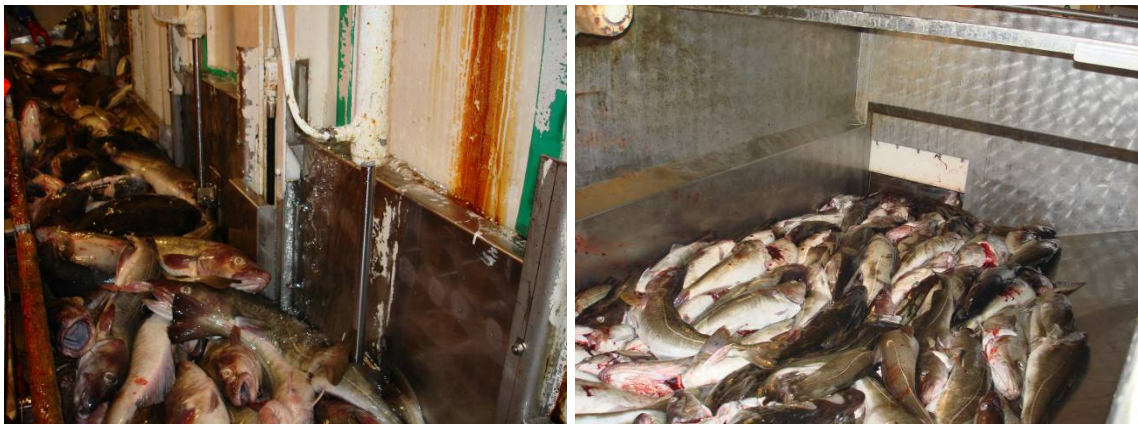
Bilde 2 Bløggeband foran binger (venstre) og blødekar overrislet av sjøvann

Lengden på utblødningstiden var ikke styrt og kunne derfor variere mye avhengig av halets størrelse. I og med at hele halet bløgges ferdig før sløyningen begynner er det vanskelig å kontrollere at fisken som blir bløgget først er den første som går videre til sløyning. Blødebingene på ferskfisktrålerne var arrangert for tørr utblødning i luft, men etter at fisken var bløgget ble den spylt/overrislet med vann i bingene for å skylle bort blod. For å få tilstrekkelig volum må blødebingene være store, men ikke for høye. Blødebingene opptar dermed det desidert største arealet på fabrikkdekket til ferskfisktrålere som denne.