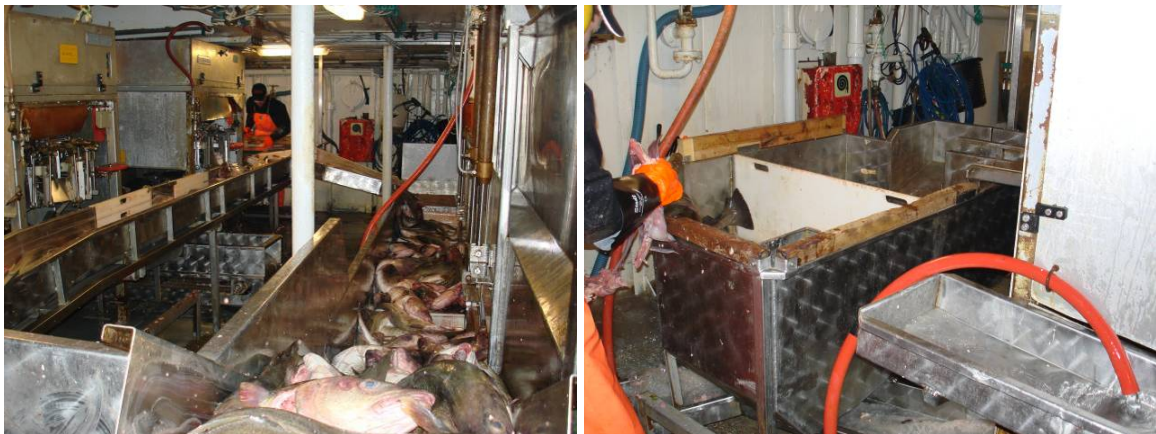
Bilde 3 Fra utblødning til sløyemaskin (venstre) eller manuell sløyning

Fisk som transporteres fra blødebingene til sløyemaskinene kan risikere å gå flere "runder". Det gir stor belastning på fisken da den får tøff behandling i transportbåndene, med mange fall. Her bør man lage en bedre løsning, som gir mer skånsom behandling.