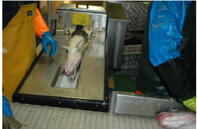
Bilde 6 Direktesløyning

Direktesløyingen ble utført i en KM-Mark 5 sløyemaskin. Fra mottaksbingene ble fisken ført på bånd til maskinen. Stor fisk og fisk av ukurant art ble håndsløyd. Mannskapet var godt fornøyd med maskinen til direktesløyning. Det ble imidlertid observert en del feilskjæring i maskinen, som førte til ødelagt fisk. Dette skyldes at fisken ikke var rolig nok under sløyingen.