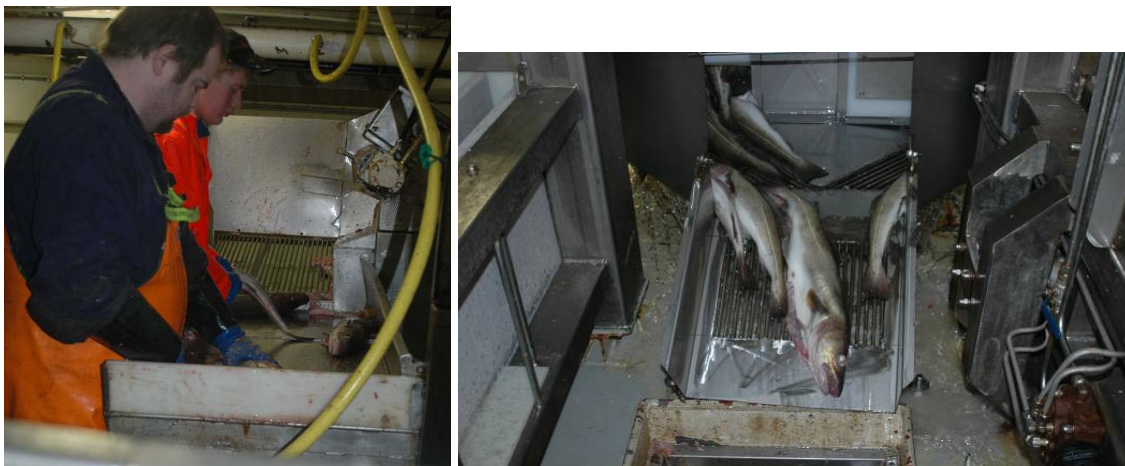
Bilde 8 Til venstre fra etterrensing, til høyre fra ventebinge med sjøvann

I stasjonen for etterrensing etter første vaske-/blødekaret ble fisken sjekket for slogrester og sortert etter art. Ombord på fartøyet var det planlagt 8 slurryfylte "ventebinger" til sortering. Under toktet var kun to av disse på plass, slik at man ikke hadde noen størrelsessorting. Fisken ble ført fra etterrensing til disse "ventebingene" der den lå i sjøvann i 1-2 timer. Hele dette oppholdet i sjøvann må regnes inn i utblødningstiden etter direktesløyting.