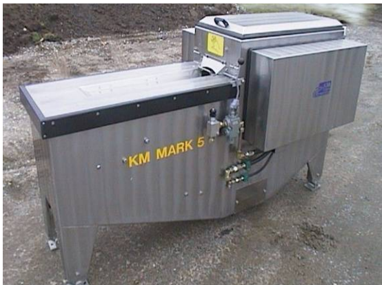
Bilde 5 Sløyemaskin (ill. foto)

Heller ikke på denne båten ble det brukt sjøvann i mottaksbingene. Dersom fangsten kunne slippes ned i en mottakstank fylt med sjøvann ville en del fisk fortsette å leve frem til den ble tatt ut til bløgging. I dag er det imidlertid vanlig å vente med å åpne mottaksbingene inn til fisken har "roet seg" (begynner å dø), og dermed blir lettere å håndtere under direktesløyning.