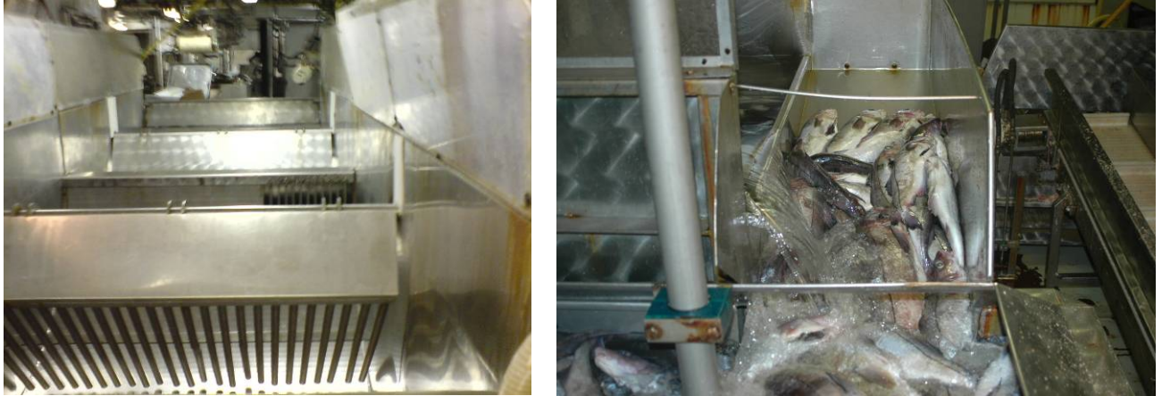
Bilde 7 Til venstre utblødningskar, til høyre fisk på vei ut av utblødningskaret

minutter, i sjøvann uten kjøling. Etter dette første trinnet ble fisken etterrenset, sortert og overført til trinn to, "ventebinger", der den lå i (slurrykjølt) sjøvann i 1-2 timer, før den ble ført videre til lasterommet.