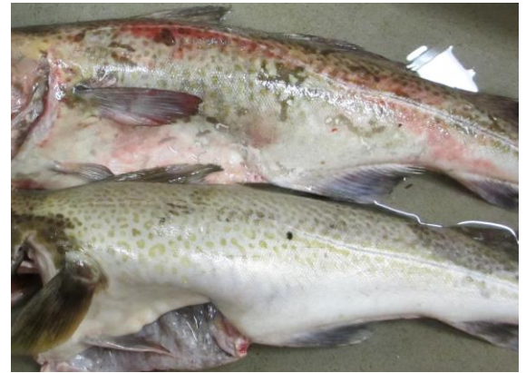
Bildet viser en sjødød torsk og en feilfri torsk