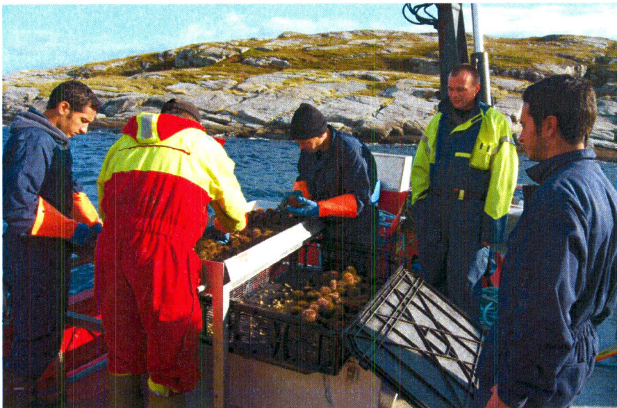
Bilde fra første forsøk i September 2009

Vi planlegger nå å gjennomføre videre uttesting på kamskjell i første omgang, samt å prøve utstyret på andre arter. Det er imidlertid svært interessant å kunne fortsette uttesting på kråkeboller da vi tror det kan være svært tids og kostnadsbesparende mot å bruke dykkere samt at det kan åpne for høsting i områder der dykking ikke kan gjennomføres.