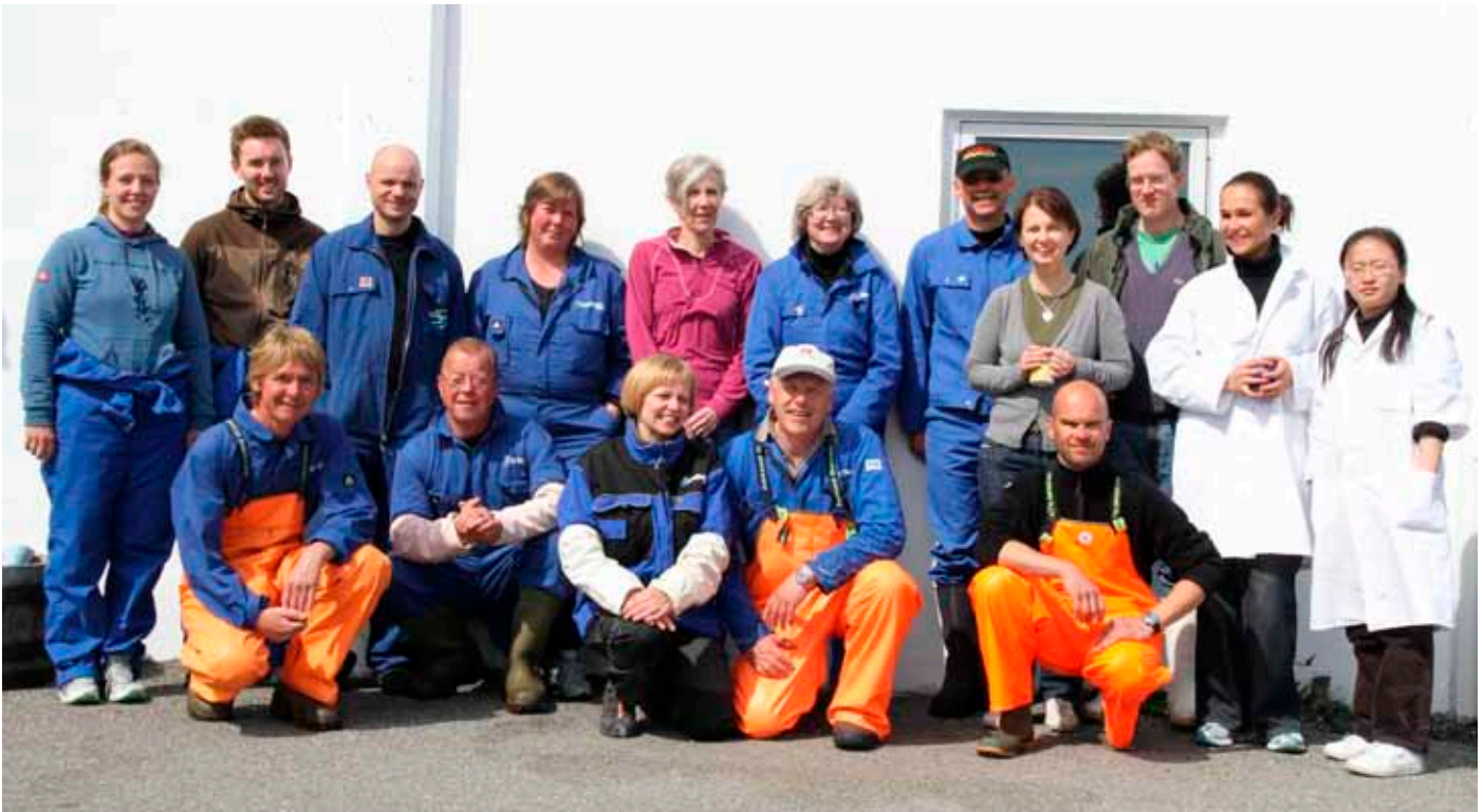
Mannskapet ved forsøkets avslutning i mai 2010.