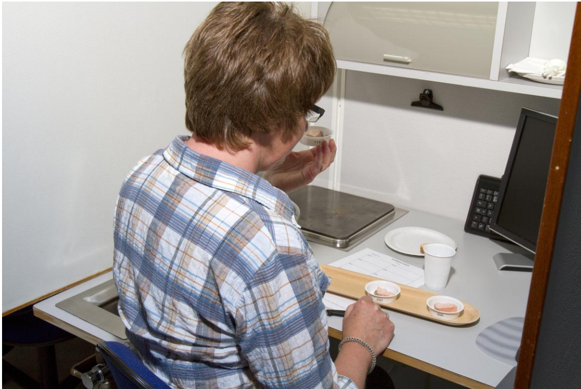
Figur 3 Sensorisk bedømmelse av laks