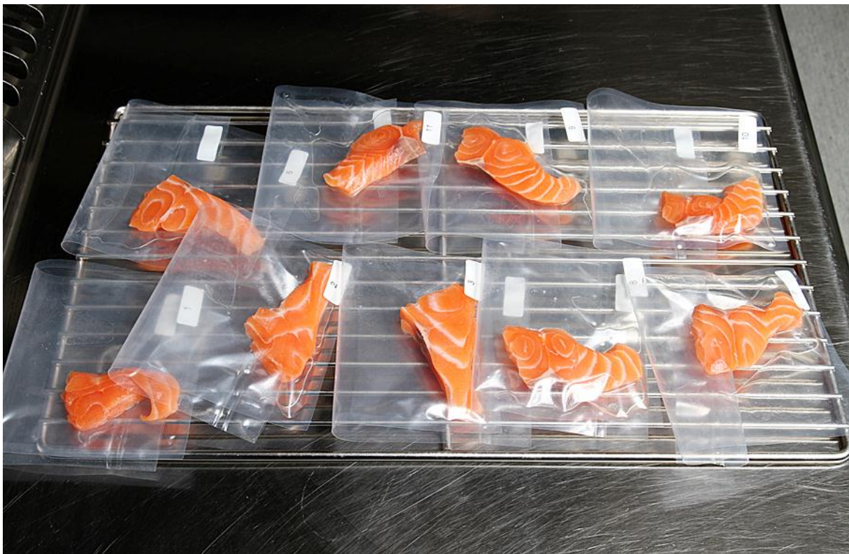
Fig 2. Lakseprøver klar for oppvarming ved 75 °C i 10 minutter. En pose med laks til hver dommer.