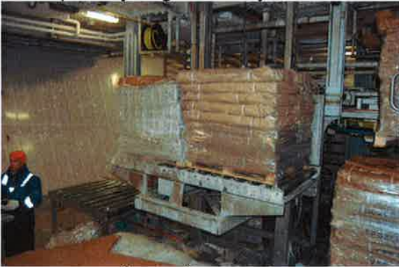
10 to pallet på vei på losseheisen

Deretter ble systemet demontert og fraktet ombord i båten og montert inn i fryserommet. Det ble også tid til noe prøvekjøring etter at systemet kom inn i båten.