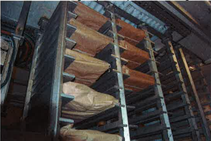
4 Helblokker og halvblokker lagret i reolsystemet, også kalt hotellet