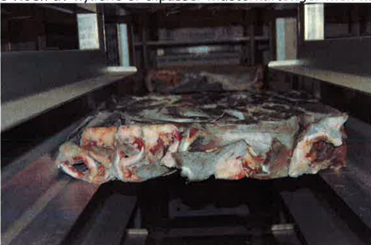
6 Det ble gjort forsøk med å kjøre inn uemballerte blokker i systemet