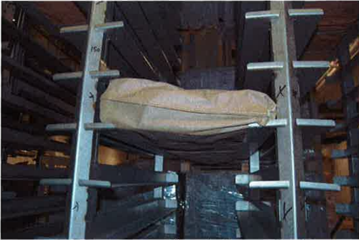
3 To halvblokker lagret på en hylle i mellomlageret