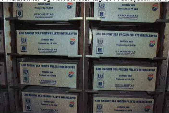
5 Noen av hyllene er tilpasser masterkartonger men kan også brukes til HG blokker