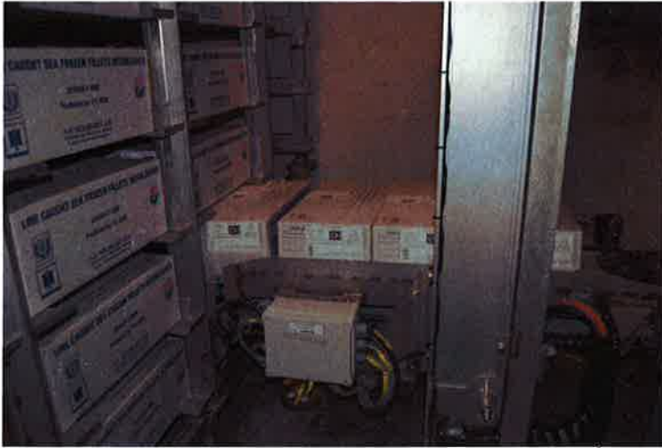
9 Masterkartonger hentes ut fra frysehotellet for å palleteres