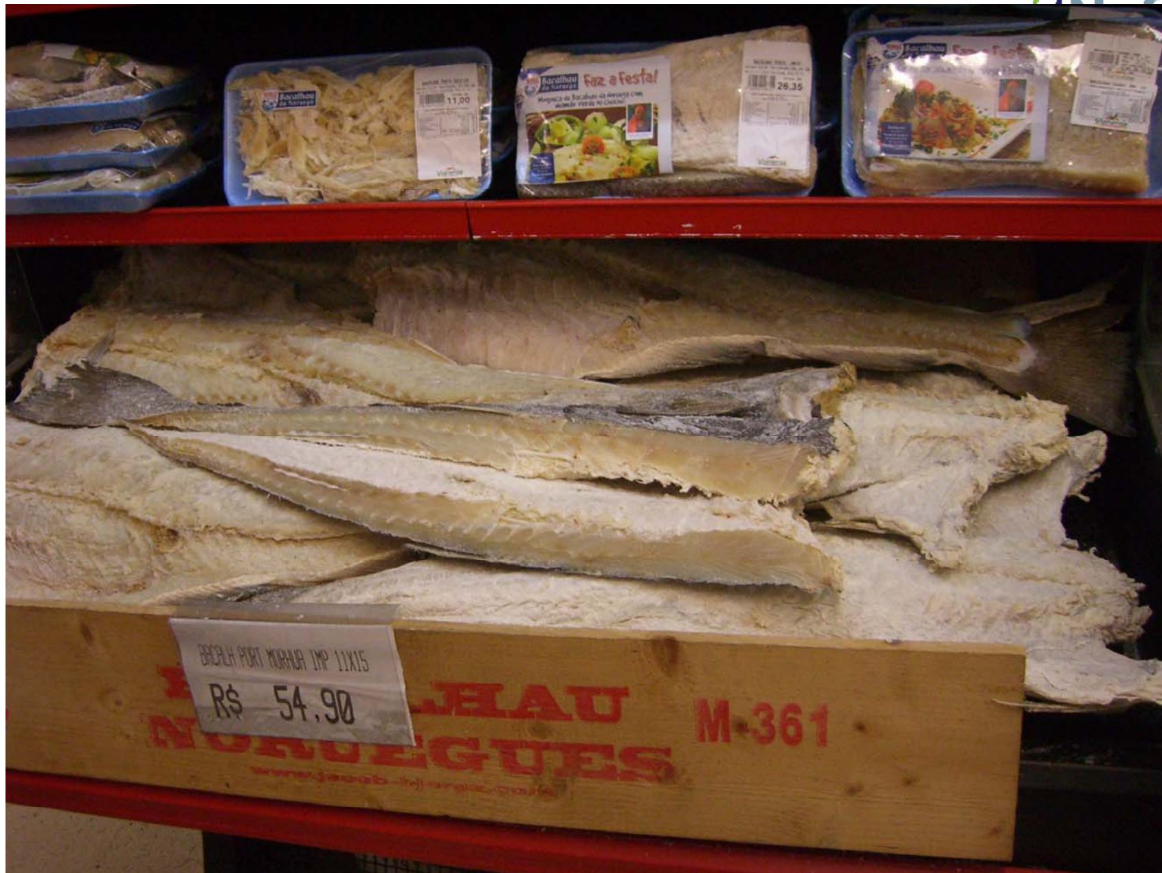
Salt-/klippfiskseminar, Tromsø 27. oktober 2010