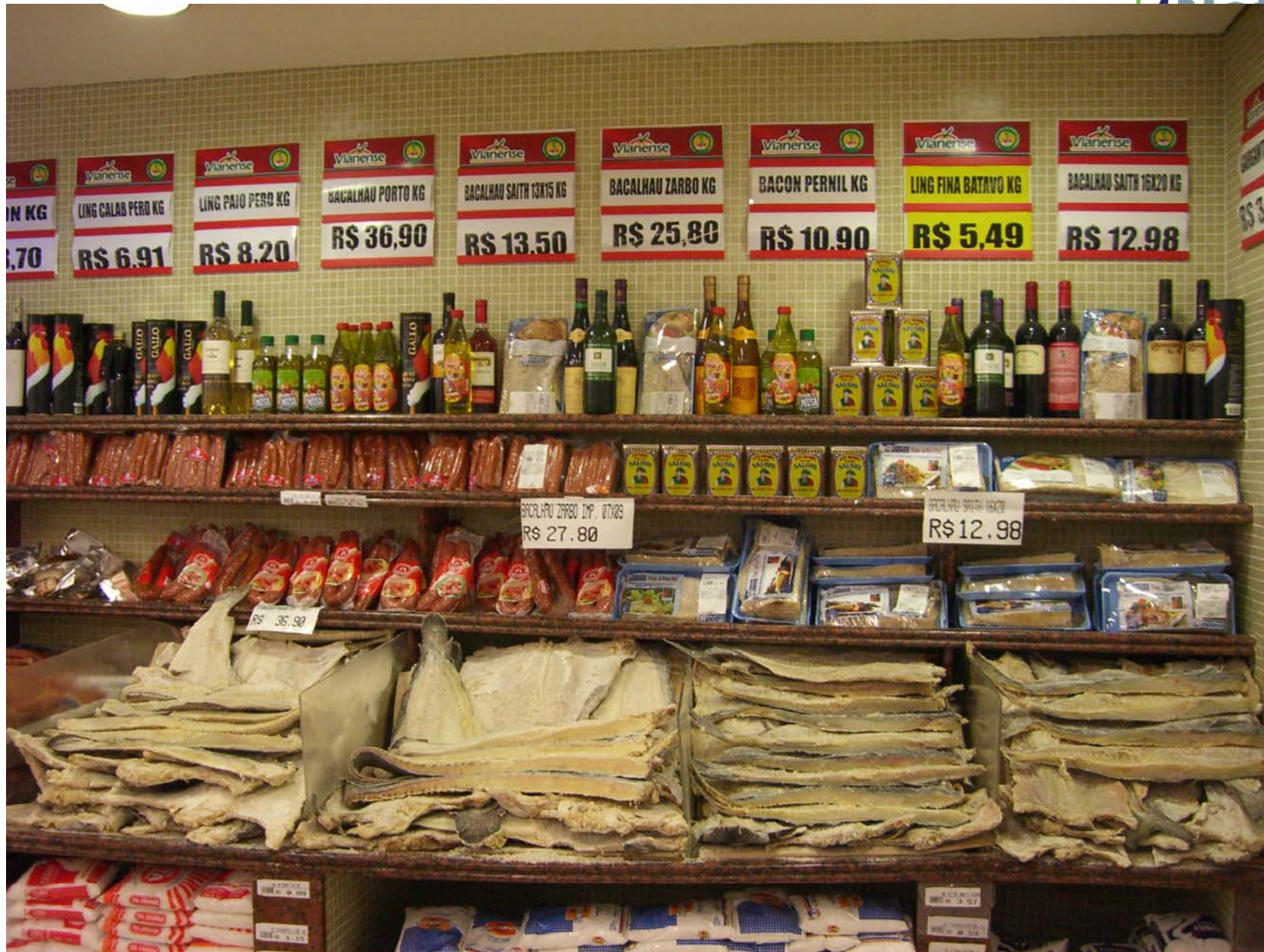
Salt-/klippfiskseminar, Tromsø 27. oktober 2010