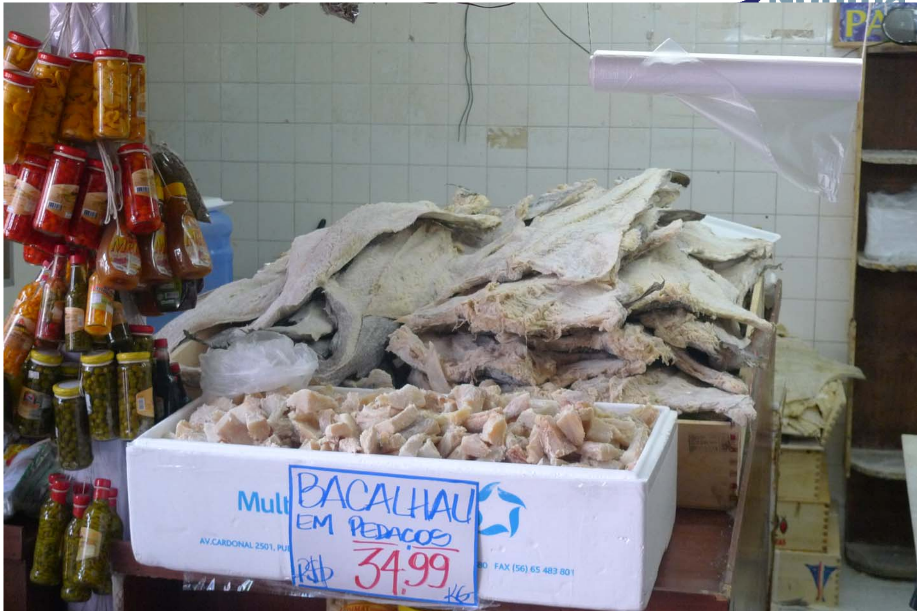
Salt-/klippfiskseminar, Tromsø 27. oktober 2010