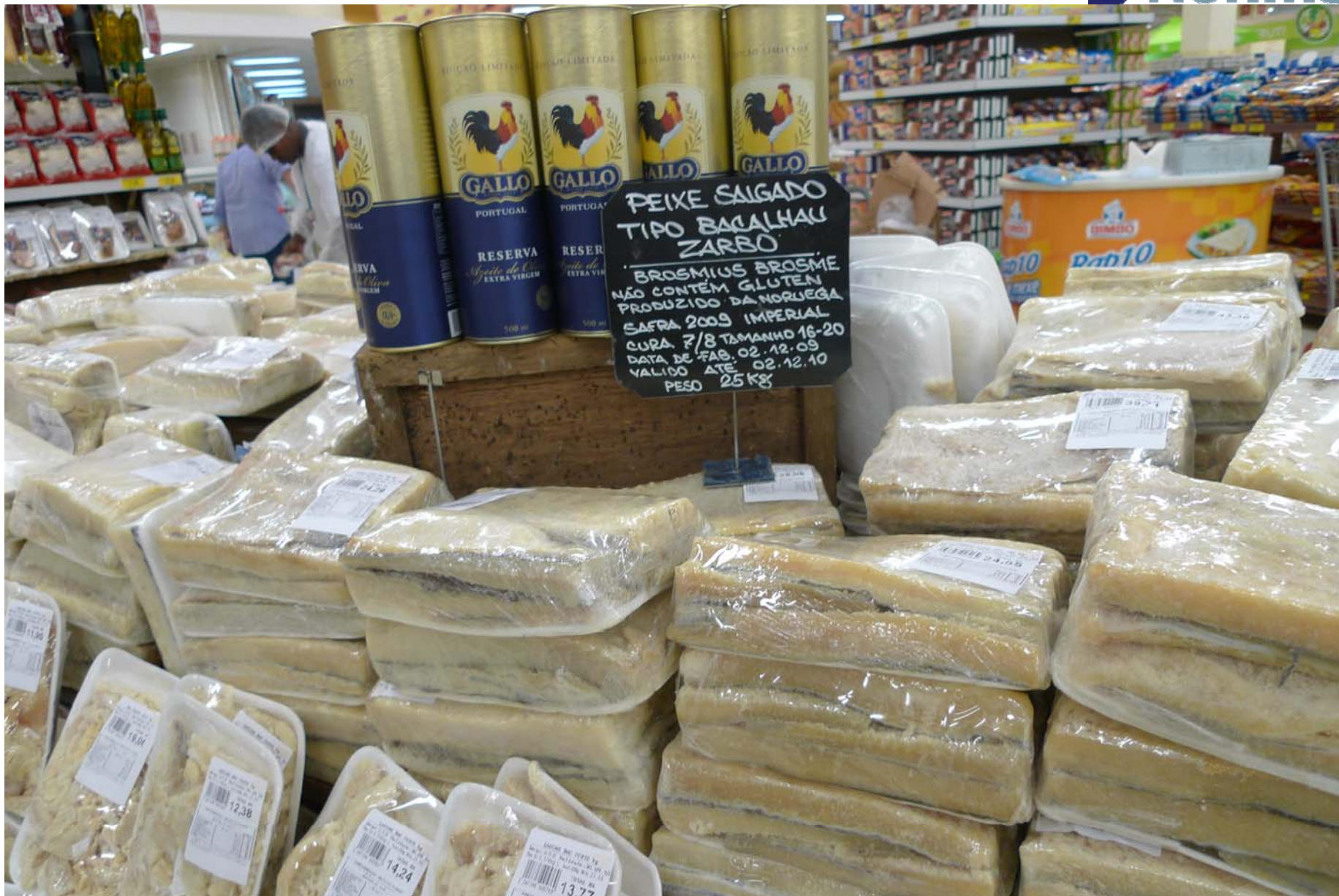
Salt-/klippfiskseminar, Tromsø 27. oktober 2010