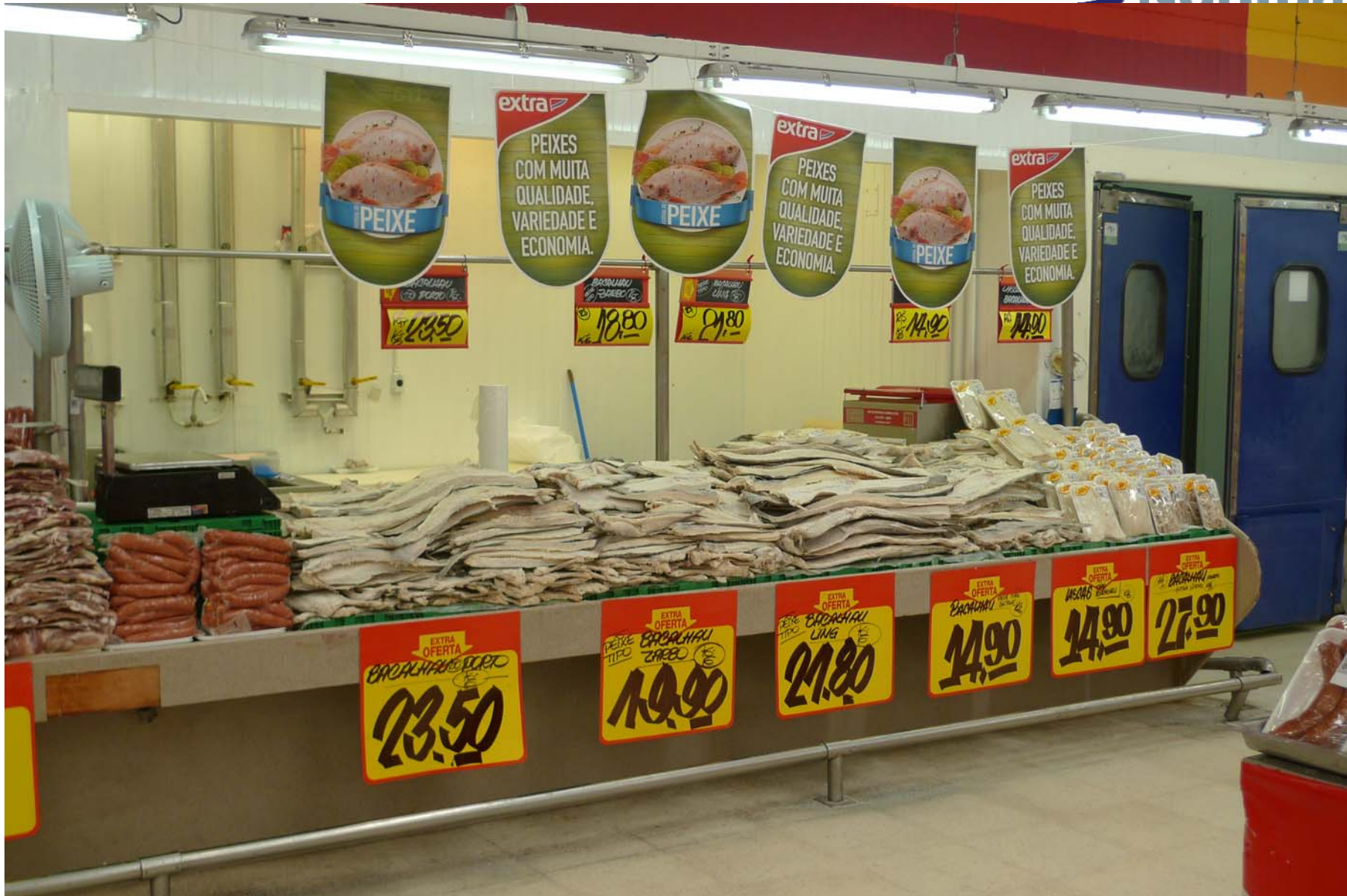
Salt-/klippfiskseminar, Tromsø 27. oktober 2010