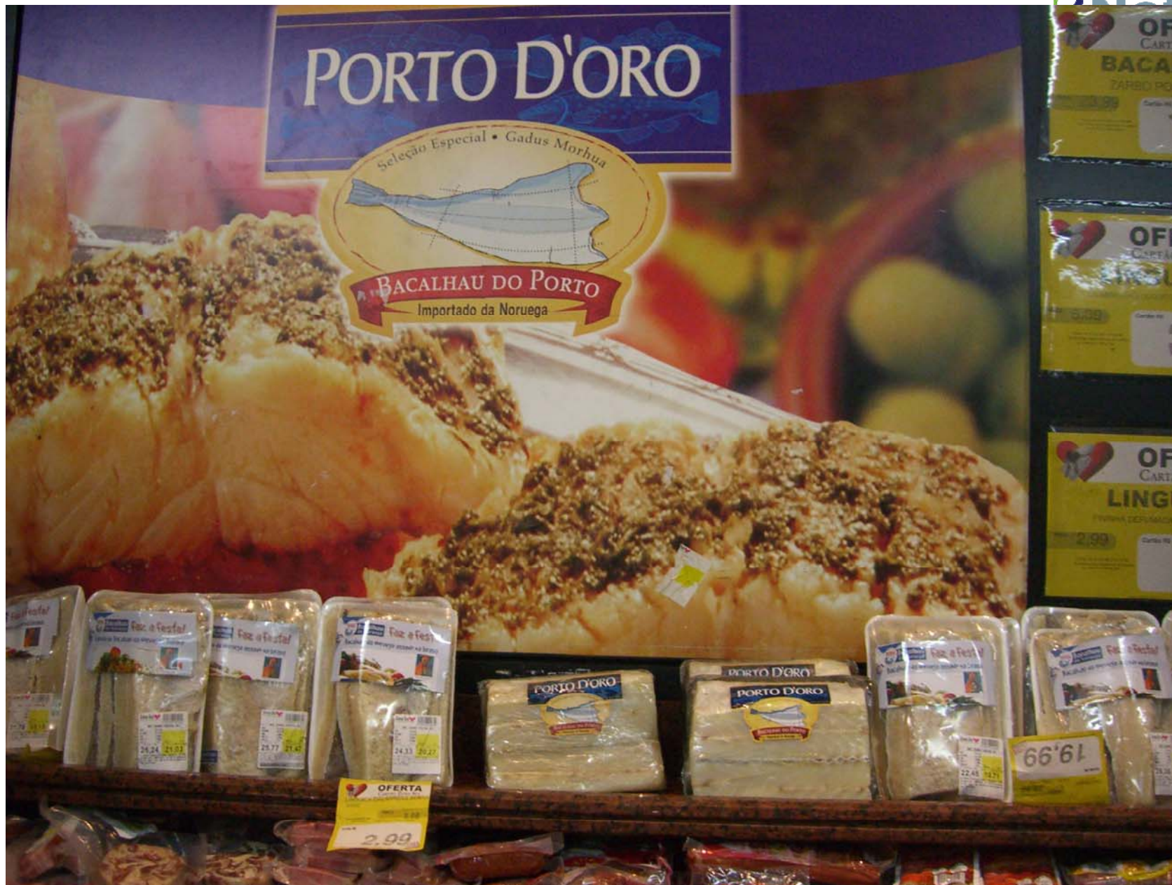
Salt-/klippfiskseminar, Tromsø 27. oktober 2010