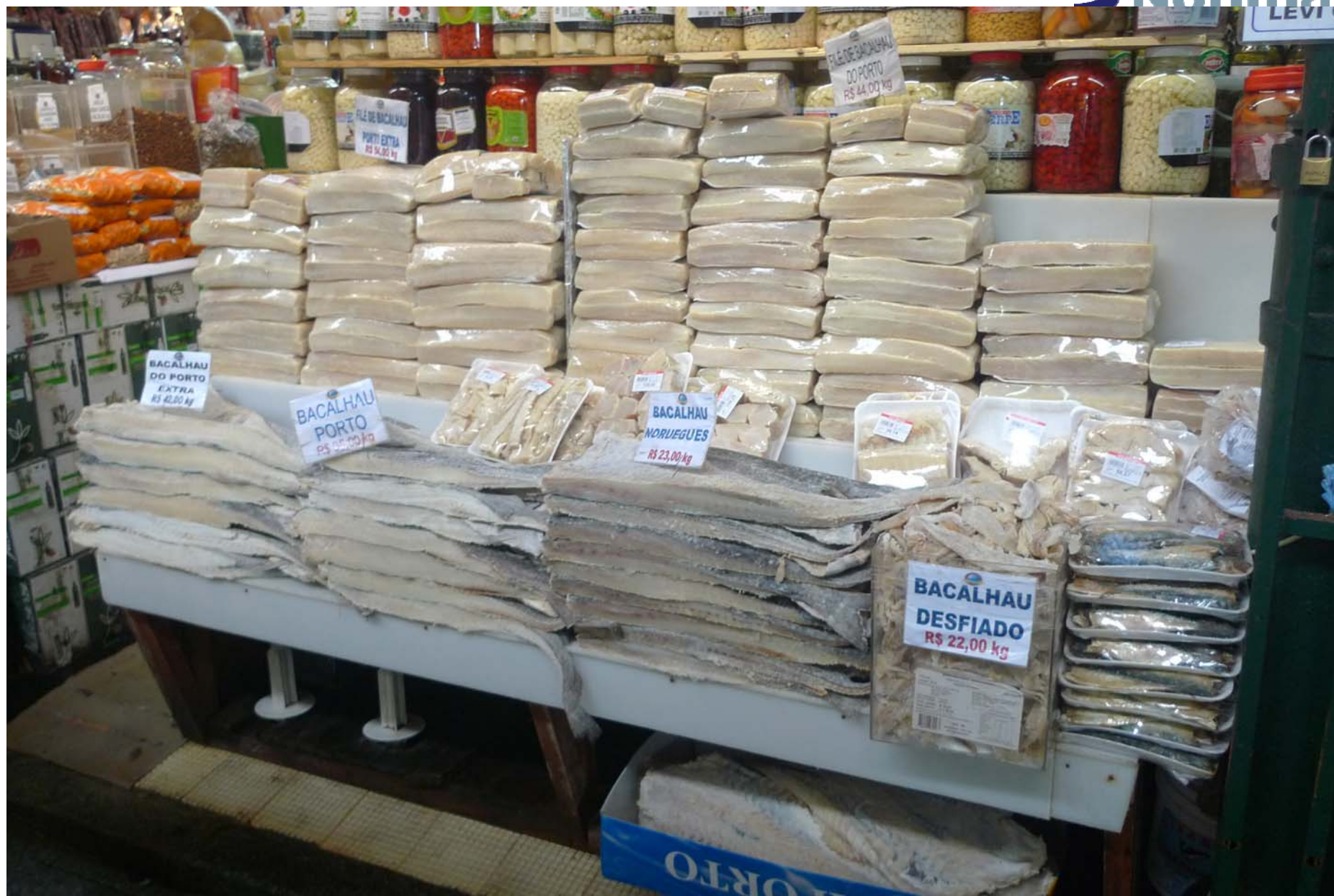
Salt-/klippfiskseminar, Tromsø 27. oktober 2010