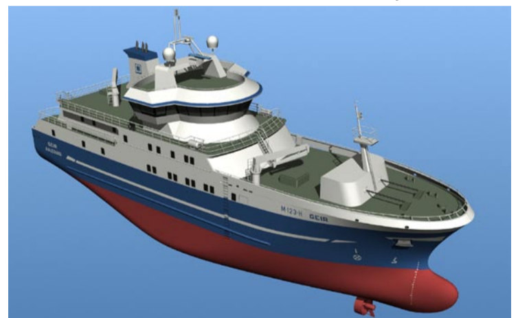
Illustrasjon: Holmeset AS

Etter år med omfattende strukturering, ønsker nå autolineflåten å utvikle fartøyene og driften gjennom økt innsats på forskning og utvikling (FoU).