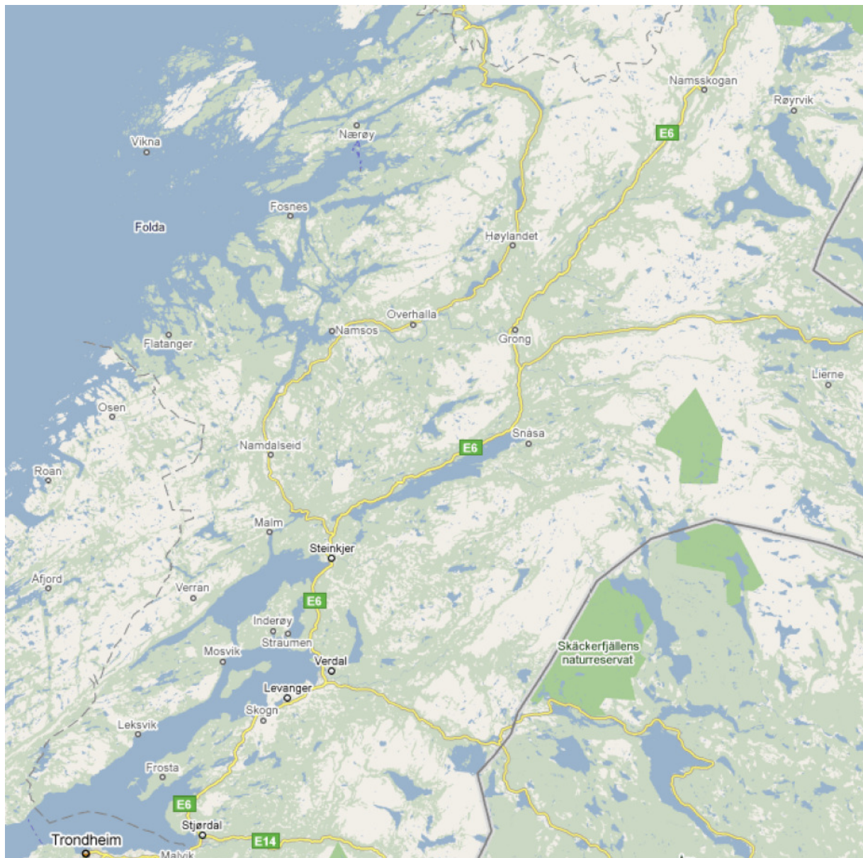
Figur 1 Oversiktskart for Nord-Trøndelag

Figur 1 gir en oversikt over området rapporten tar for seg. Figur 2 og 3 viser de fleste lakse- og sjørret-elvene i Nord-Trøndelag. De fleste av vassdragene omtalt i rapporten finnes igjen på disse kartene.