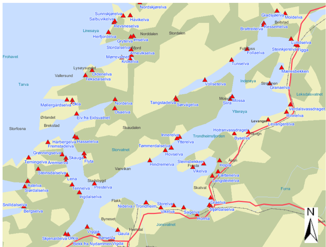
Figur 3: Lakse- og sjørretelver i Trøndelag rundt Trondheimsfjorden.