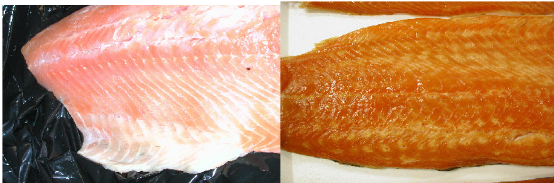
Bilde 1. Avfarging av røykt laks.

Det er velkjent at laksefisk akkumulerer store mengder astaxanthin og canthaxanthin i muskelen, som er årsaken til laksefisks røde muskelfarge. Andre carotenoider som er vanlig i muskel hos laksefisk er zeaxanthin, cynthiixanthin, \beta -doradexanthin og diatoxanthin (Henmi et al. 1989). I muskelen antas det at \beta -ionone ringen av astaxanthin binder seg til et hydrofobisk bindingssete på overflaten av actomyosin-proteinkomplekset (Henmi et al. 1989; Henmi et al. 1987), som er en ikke-vannløselig fraksjon med opprinnelse fra myofibrilproteiner. Nyere forskningsresultater indikerer at det i tillegg er andre proteinfraksjoner som har større affinitet enn actomyosin til å binde astaxanthin (Saha et al. 2005; Saha et al. 2006).