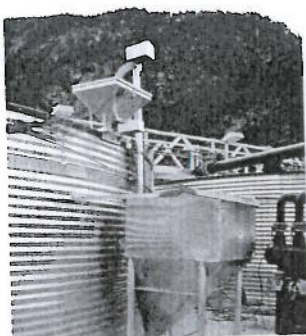
Settefiskautomat type S1, med fyller (1000kg) Fra Lerøy, avd. Valsøybotten.