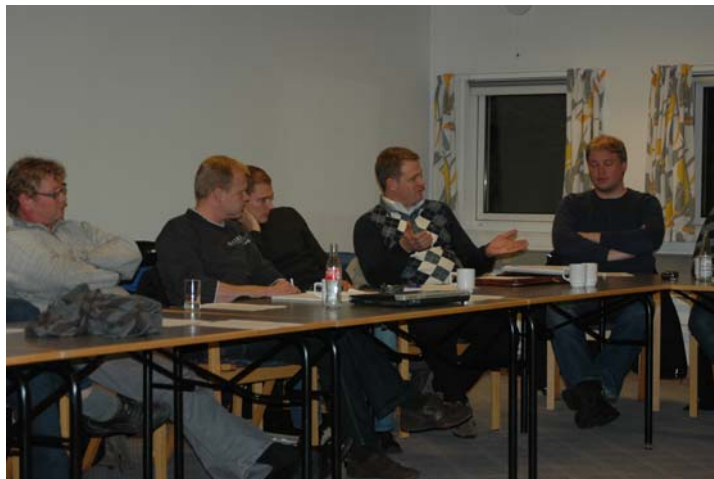
Bilde 9. Plenumsdiskusjon – sikkerhetskritiske vs. produktivitetskritiske komponenter.

De teknologiske løsninger som defineres under sikkerhetskritiske komponenter, kan det være aktuelt å knytte direkte opp mot, og eventuelt forankre i kravene som ligger i standarden NS 9415. Retningslinjer og beskrivelse av utprøving kan knyttes direkte til standarden, slik det er vanlig for standarder for andre typer utstyr. Med uttrykket sikkerhetskritisk , forstår man da komponenter som er kritiske for anleggets fysiske integritet og sikkerhet mot rømming av fisk, skade på folk m.v.