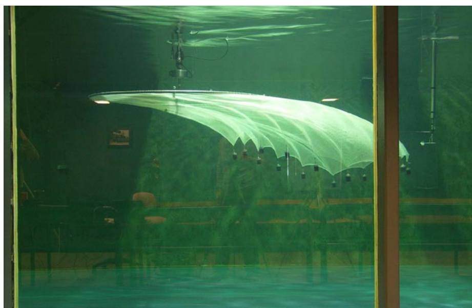
Figur 3. Modelltesting av merd med not under ulike strømhastigheter i sirkulasjonstank i Hirtshals, Danmark.