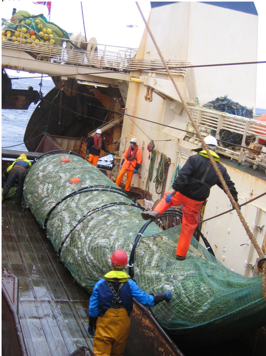
Bilde 1. Et bra hal med kun stor torsk.

fangstmengdesensorene som tiltenkt når fisken ikke transporteres fortløpende bak i posen.