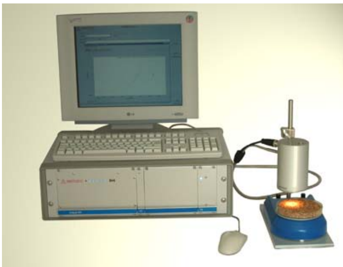
Figur 1 Dette bildet viser NIR proben. Vi brukte en bærbar PC.