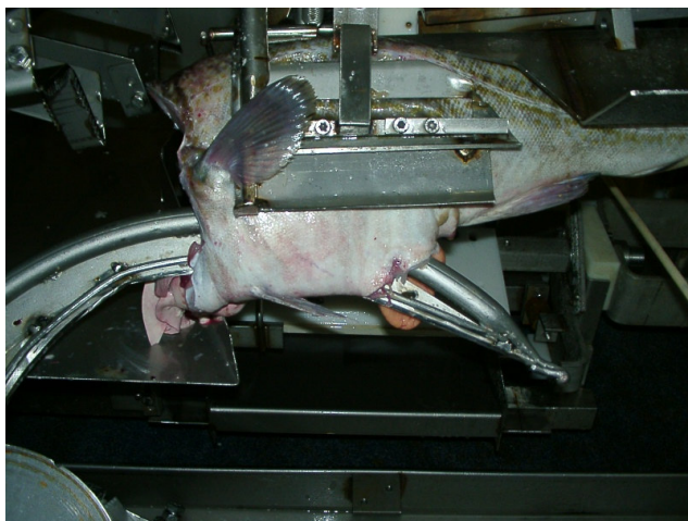
Bilde 1. Første steg i åpning av buken