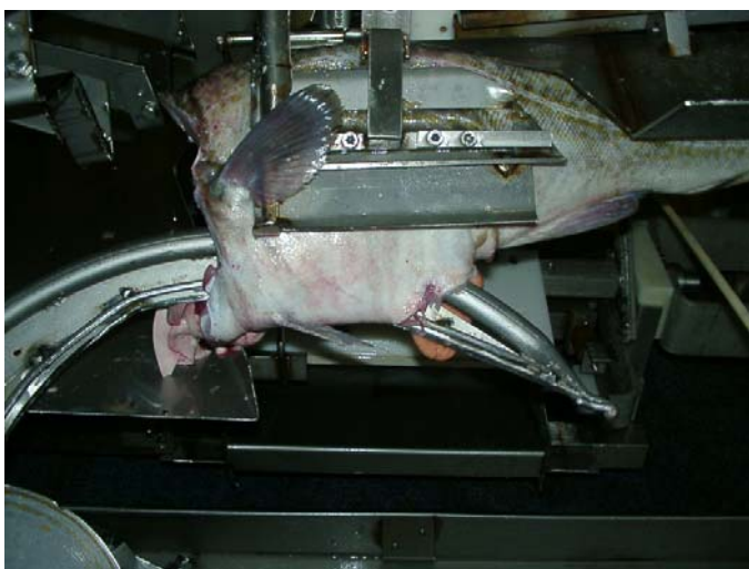
Bilde 1. Første steg i åpning av buken

Sløyemaskinen er i dag installert hos 8 redere. Før man eventuelt følger opp prosjektet i forhold til videre utvikling var det viktig å få en oversikt over erfaringer båtene har med dagens Baader 444. RUBIN gjennomførte derfor en intervjuundersøkelse med brukerne av utstyret. 7 av 8 redere som har maskinen installert ble intervjuet.