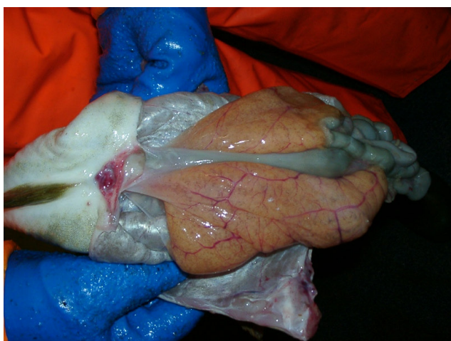
Bilde 3. Hel rogn, slik den er i 50% av tilfellene etter manuell uttak,