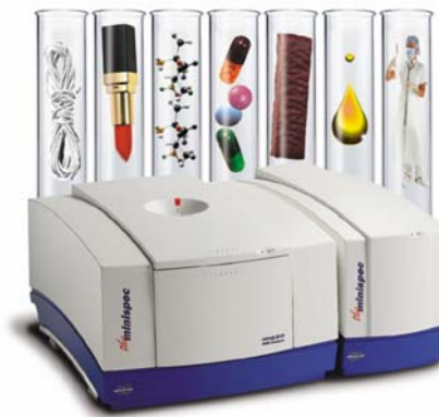
Figur 2. Minispec mq series lavfelt NMR instrument (Bruker Optik GmbH, Tyskland)

En annen fordel med NMR-metoden er at NMR-signaler er lite følsomme for små variasjoner i mikroskopiske egenskaper ved råvarene i fôret. Derfor har råvarens opprinnelse – som for eksempel fiskeoljers opprinnelse – ingen vesentlig innvirkning på de observerte NMR-signalene. Hyppige kalibreringer er derfor ikke nødvendig.