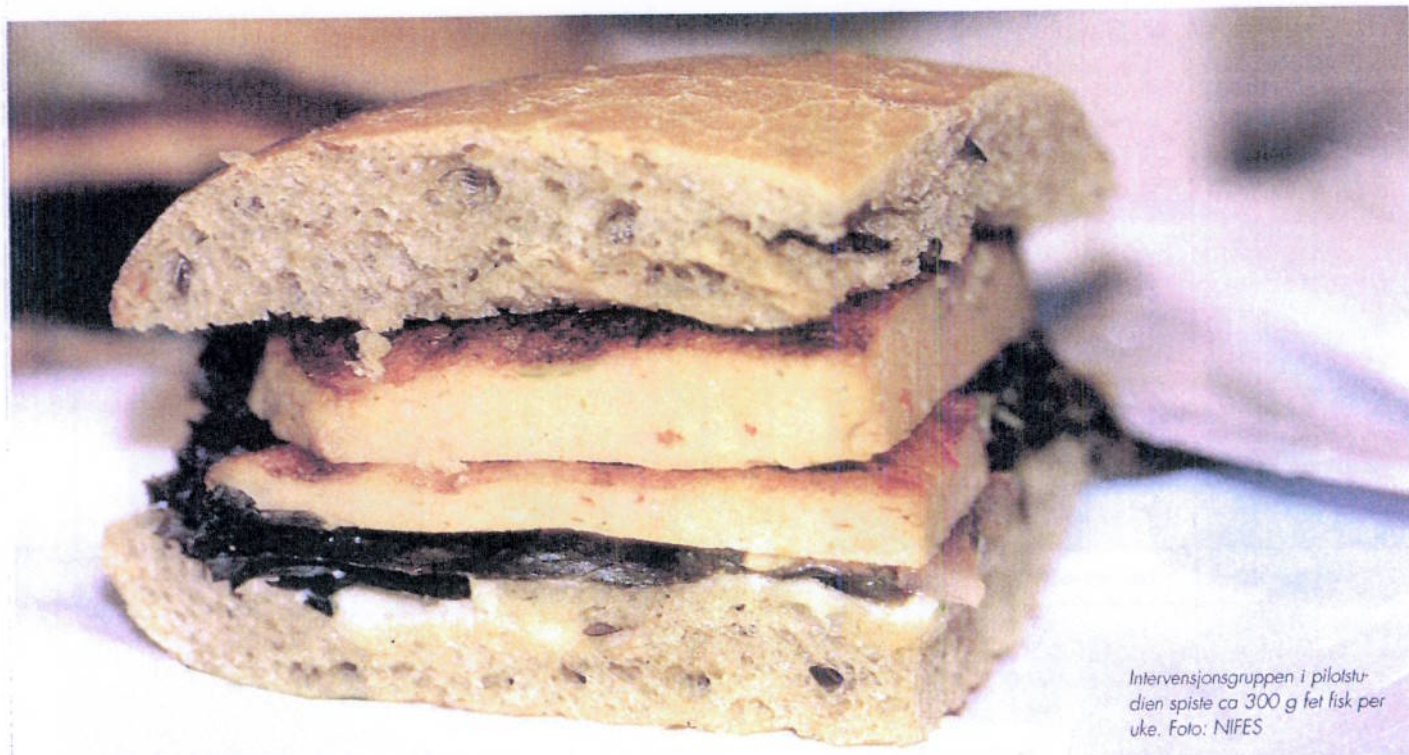
Intervensjonsgruppen i pilotstudien spiste ca 300 g fet fisk per uke.

Dette ble gjort med innsamlende data for alle elevene ved studiestart, for å utelukke en mulig læringseffekt av å utføre d2-testen flere ganger og fordi elevene på dette tidspunktet ikke visste hvilken av de tre gruppene (sjømat, alternativ lunsj eller kontroll) de tilhørte. Resultatene viste at det var en signifikant negativ korrelasjon mellom kjønn og vitamin D, noe som indikerte at guttene hadde en lavere vitamin D-status enn jentene. I tillegg var det en signifikant positiv korrelasjon mellom kjønn og ratio omega-6 til omega-3 fettsyrer, hvor guttene hadde en høyere ratio omega-6 til omega-3 fettsyrer enn jentene. Resultatene viste også en signifikant negativ korrelasjon mellom kjønn og symptomscore for psykiske vansker, hvor guttene rapporterte mindre symptomer på psykiske vansker enn jentene. Videre viste resultatene at jernstatus var positivt relatert til elevenes score på konsentrasjonstesten. For vitamin D ble det funnet at jo høyere vitamin D-nivå, desto lavere var ratio omega-6 til omega-3 fettsyrer. Studien viser også en signifikant negativ korrelasjon mellom symptomscore for psykiske vansker (SDQ) og score på konsentrasjon (d2-testen). Jo høyere symptomscore for psykiske vansker desto dårligere resultat på konsentrasjonstesten.