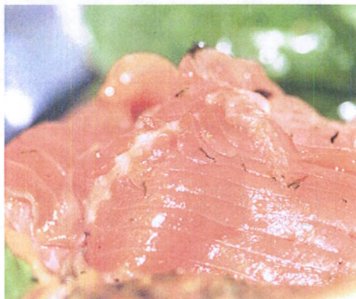
Inntaket av sjømat blant barn og unge er lavt og gevinstene ved et økt inntak vil trolig være stor for nettopp denne gruppen.

For å måle elevenes konsentrasjonsnivå ble d2 testen for oppmerksomhet benyttet (23). Testen består av 14 linjer, hvor hver linje inneholder 47 spredte "p" og "d" tegn. Hvert av tegnene har enten en eller to apostrofer over og/eller under seg, og forsøkspersonen skal i løpet av en 20 sekunders periode krysse ut så mange relevante "d2" tegn som mulig. Den samme instruksjonen ble gitt for de resterende linjene og forsøkspersonen gjennomførte testen uten pause mellom linjene. I etterkant av testen blir den totale prestasjon (TN - E) målt ut i fra antall tegn (TN) som er krysset ut minus antall feil (E). Testen måler forsøkspersonenes evne til selektiv oppmerksomhet og evnen til å holde oppmerksomheten over en bestemt periode. Ved studiestart ble denne testen gjennomført før de tre elevgruppene visste hvilken forsøksgruppe (sjømat, alternativ lunsj