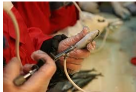
Fiskehelse og fiskevelferd