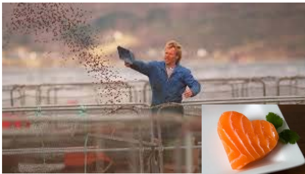
Fôr og ernæring for fiskens helse og for konsumenten