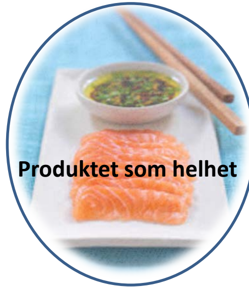
Produktet som helhet