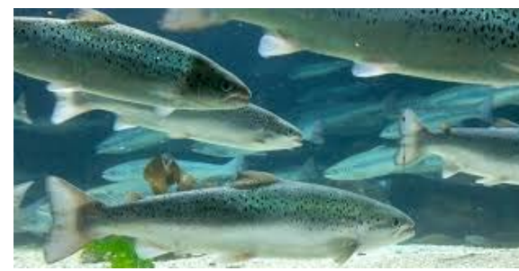
Næringens påvirkning på miljøet - fotavtrykk