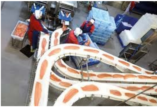
Prosess og kvalitet