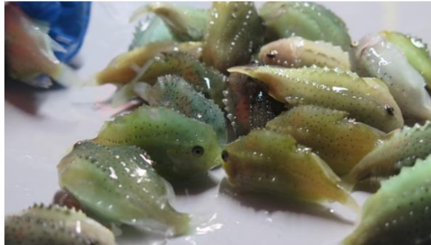
Rognkjeks blir brukt til å rense oppdrettslaksen for lus.

Dyrevernerne er bekymret over den kraftige økningen i bruken av rensefisk i oppdrettsnæringa. Mens det i 2016 ble brukt om lag 24 millioner fisk, tyder mye på at tallet er nært doblet i fjor.